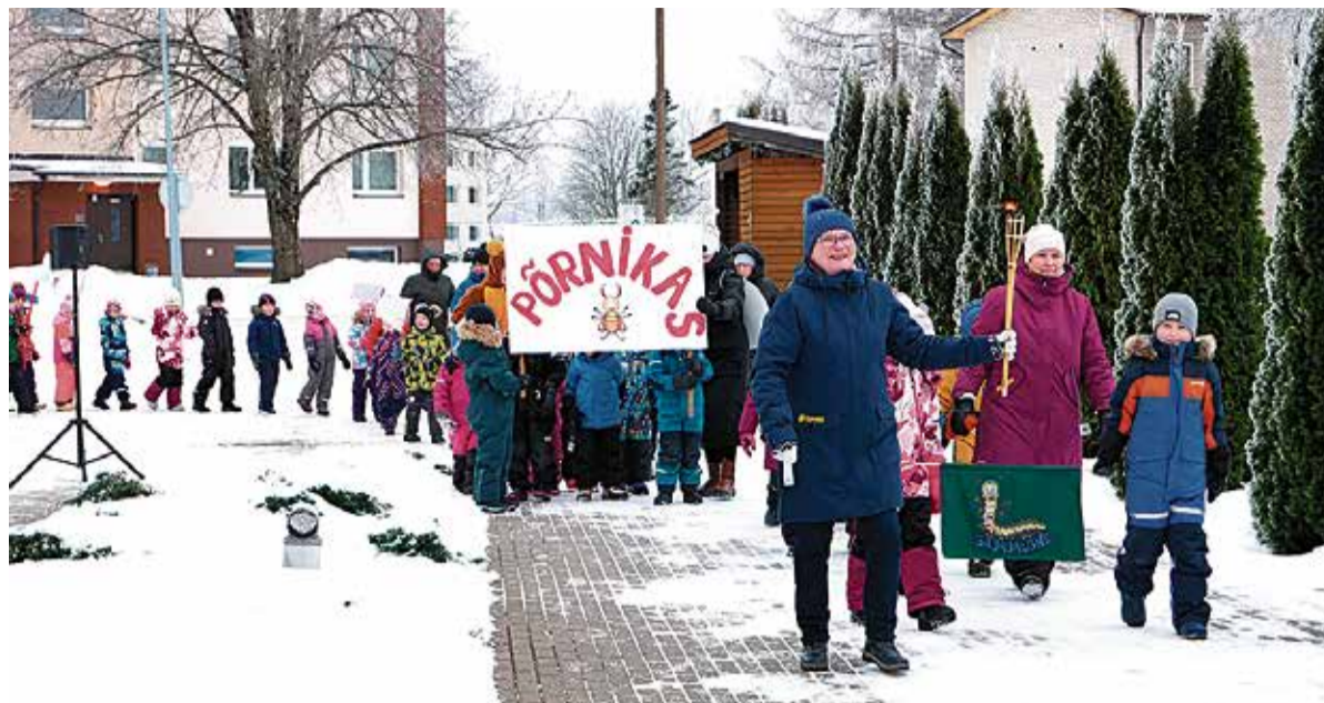
Rongkäik suundub olümpiatuld süütama.