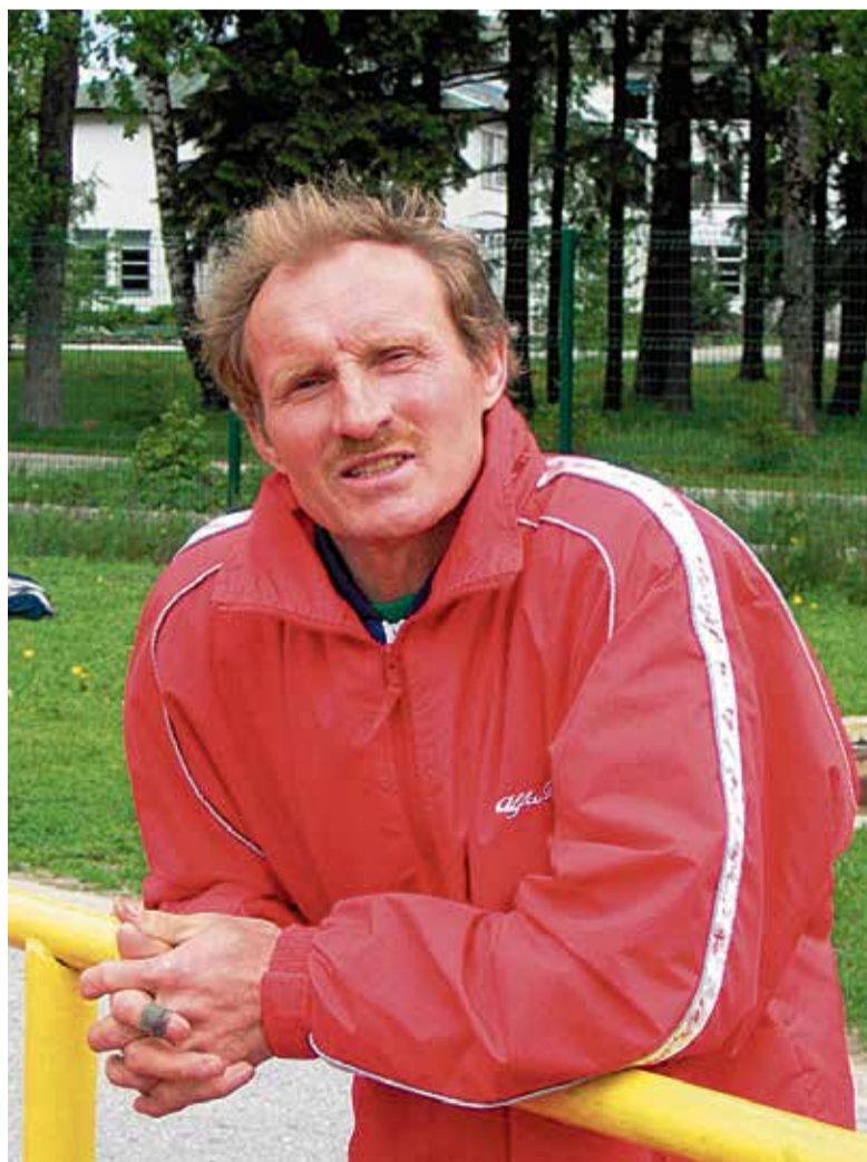
Leho TV 10 võistlustel Türil.

Estorni juhendamisel on sirgunud mitmeid häid sportlasi.