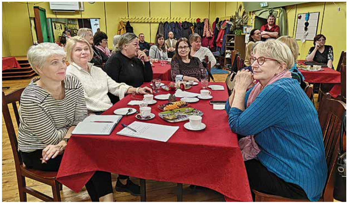
Laudkonnas olevad Leie, Vissuvere ja Valma külade esindajad on kogukonnapäeva aktiivsed külalastajad.

Päev, mis ei väsita, ei ole täiuslik päev, kus miski ei lähe valesti. See on päev, kus sa lubad endal olla inimene, mitte lõputu masin – ja kohtled oma energiat kui piiratud, aga hoolitsemist väärt ressursi.