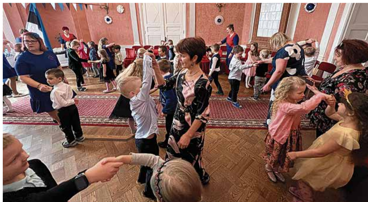
Presidendi vastuvõtu avavalss Kärstnas.