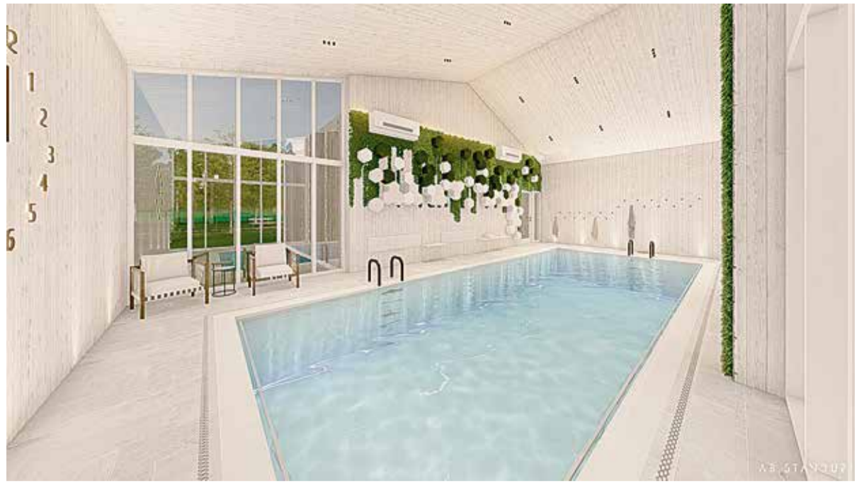
Tarvaste lasteaia Soe maja juurde rajatava basseini visuaal. Arhitektuuribüroo Standup OÜ

Eelarve on meie ühine kokkulepe, millist valda me tahame. 2026. aastal valime arengu – läbimõeldult, samm-sammult ja kindla pilguga tulevikku.