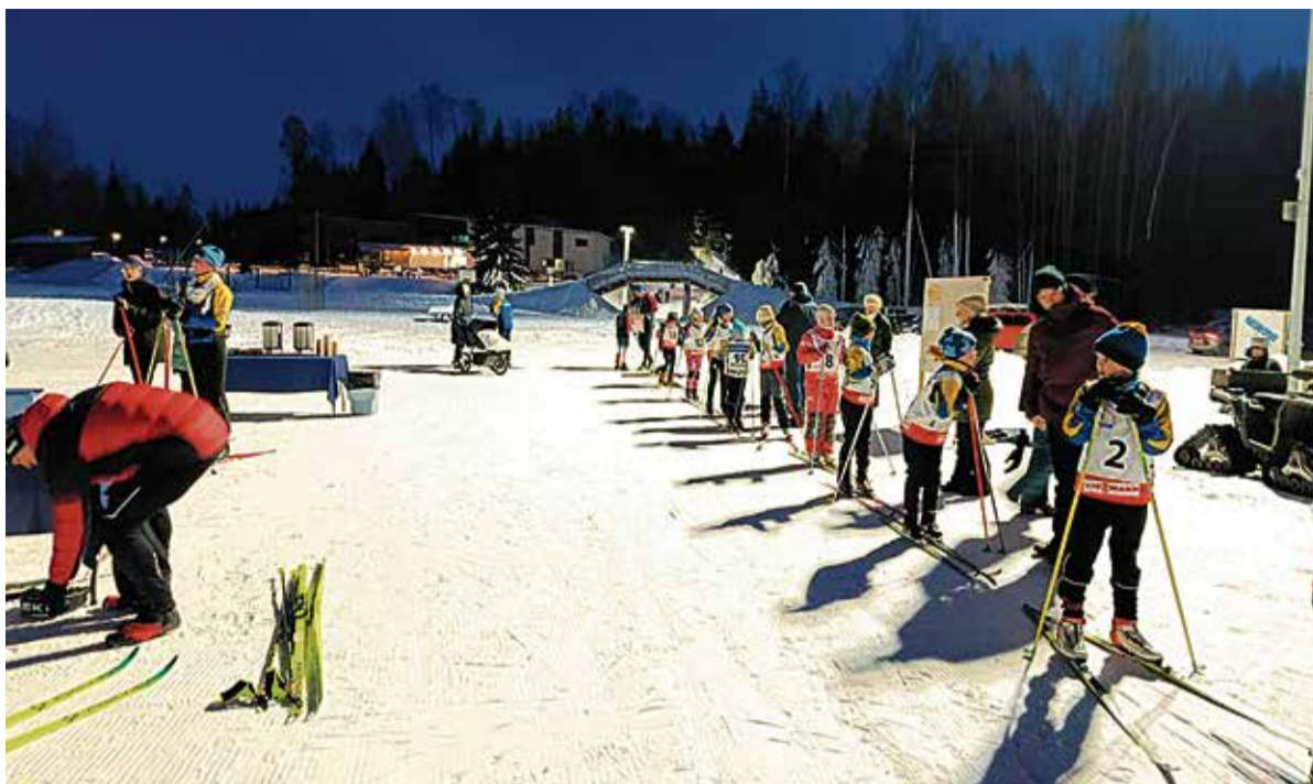
Maakonna meistrivõistlustel starti ootamas.