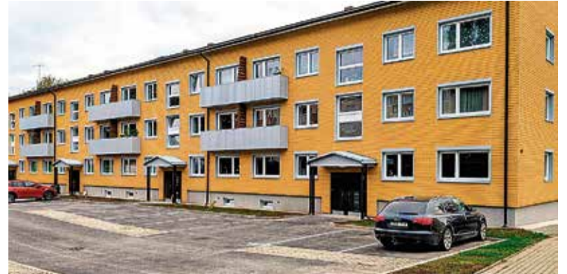
Kortermaja Viiratsis, mis sai toetust vallalt 2025. aastal autoparkla uuendamiseks.

Toetuse suuruseks on kuni 50% kavandatud töö kogumaksumusest, kuid mitte rohkem kui 5000 eurot ühe taotleja kohta või 7000 eurot iga ühistaotlu-