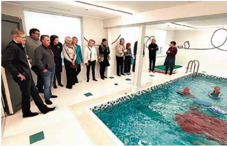
Viljandi vallavolikogu ja vallavalitsuse liikmed käisid ühisringreisil Kolga-Jaanis ja üheks sihtkohaks oli ka sealne lasteaed. Tutvuti Naksitrallide lasteaia ujumisvõimalustega, mis on populaarsed ja arendavad piirkonna laste ujumisoskusi.