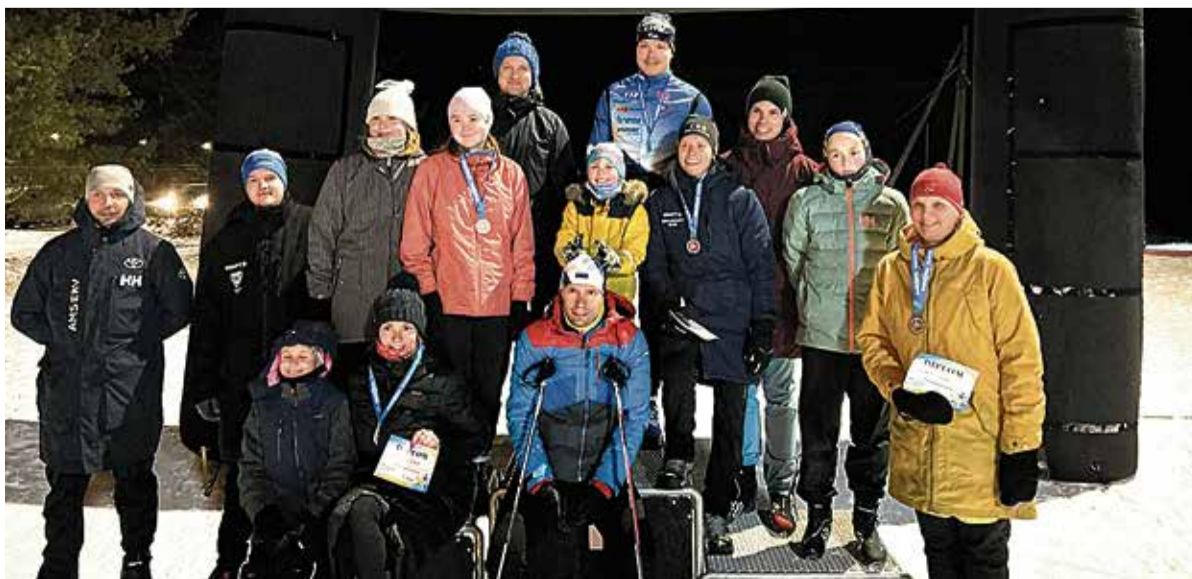
3. koha saavutanud Saarepeedi küla esindus külade mängudel.