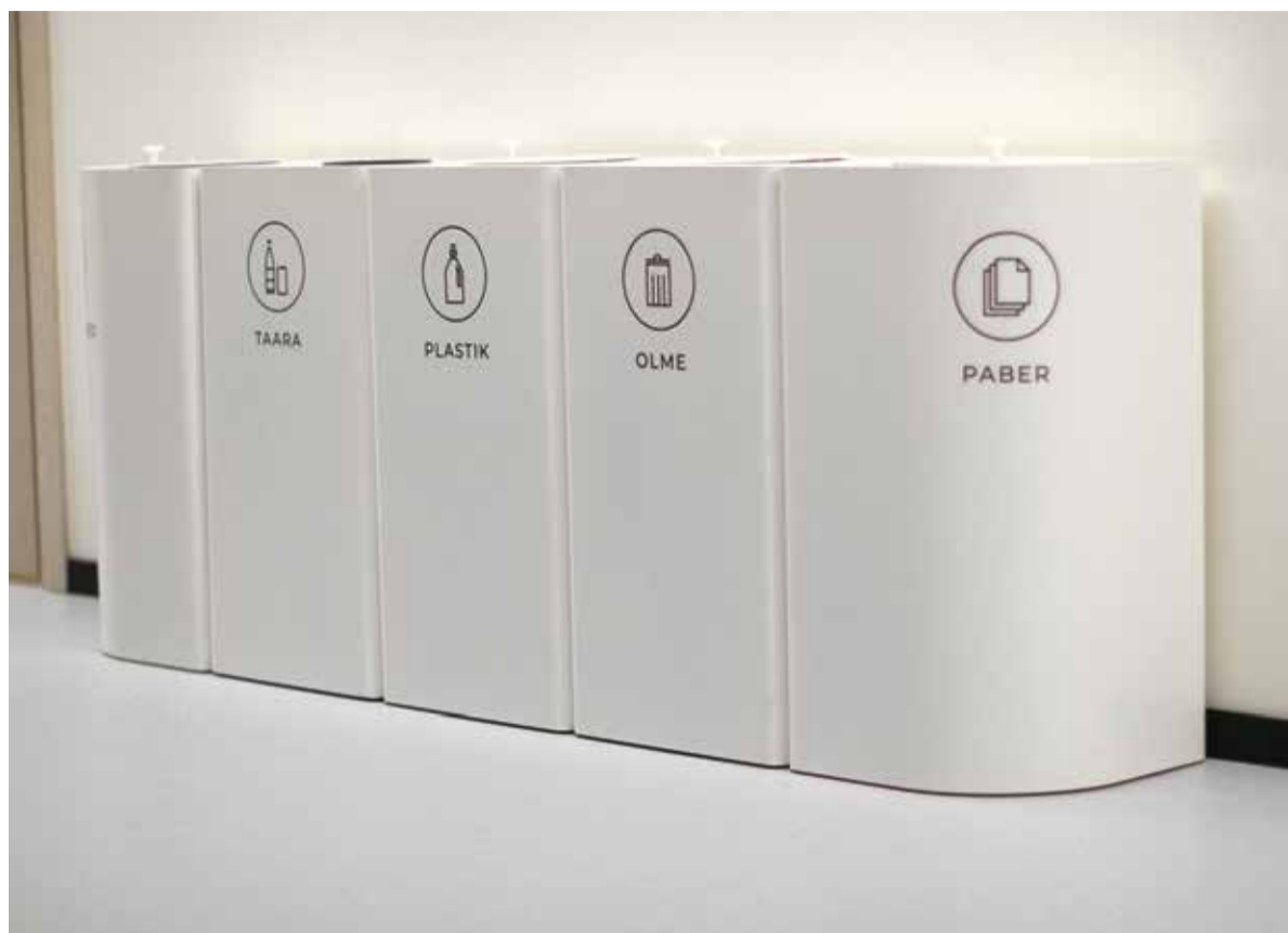
Sorteerimisjaam on mugav abivahend jäätmete liigiti kogumiseks.

Arusaam, kuidas jäätmeid õigesti sorteerida ja miks see süsteem oluline on, aitab muuta kogu jäätmekäitlust tõhusamaks ning vähendada seeläbi keskkonnamuutust.