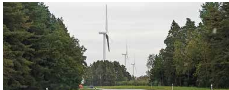
Estimaal ringi söites võib kohata sellist pilti.