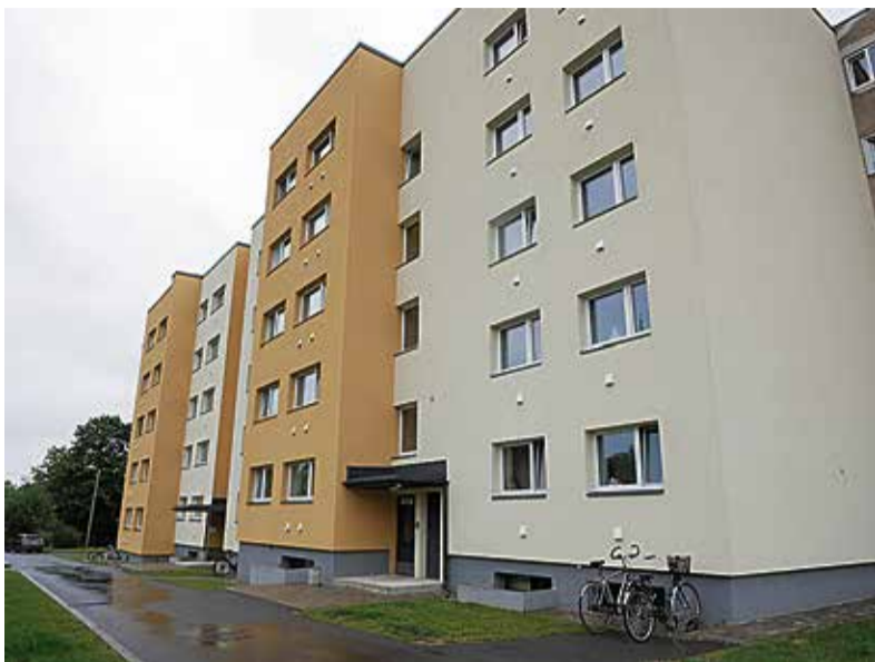
Jaanuaris toimus korteriühistutele suunatud infoseminar, mida on võimalik järelle vaadata RTK kodulehelt.

2026. aastaks on taotlusvooru kogumaht 988 092 eurot. Toetuse abil saab luua uusi või parandada olemasolevaid varjumiskohti korterelamutes, et elanikel oleks võimalik ohuolukorras kiiresti ja tõhusalt varjuda.