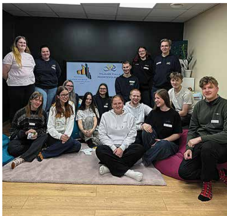
Viljandi valla ja Kuusalu noortevolikogu liikmete kohtumine.

Sellised kohtumised ei ole olulised ainult noortevolikogude liikmetele. Kogemuste jagamine aitab tugevdada noorte omava-