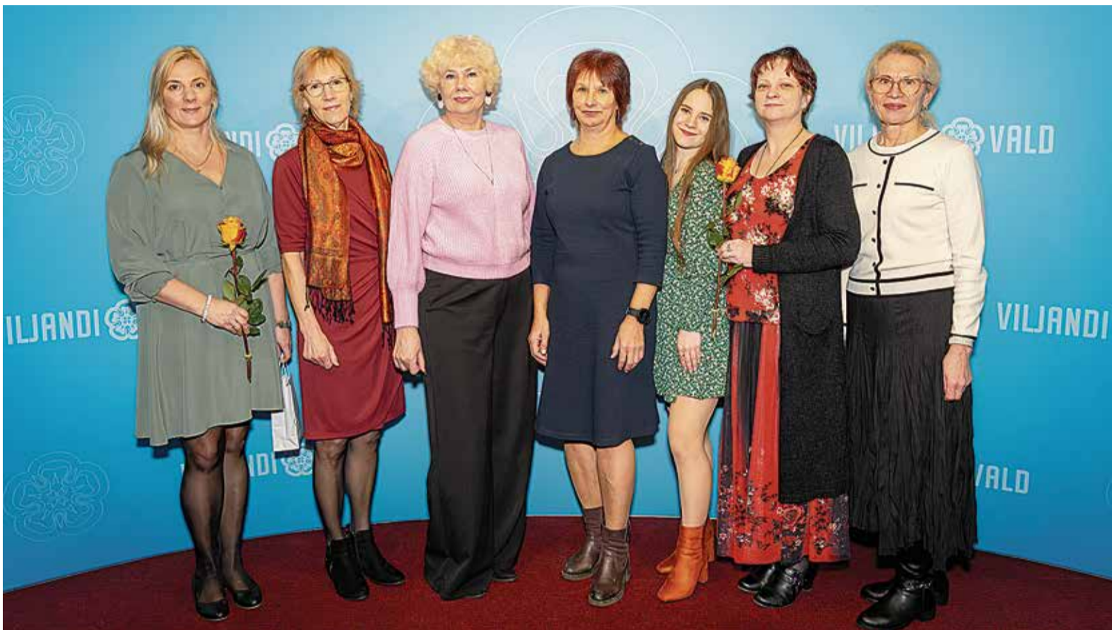
Viljandi valla rahvamajade juhid kogusid ühispilele kultuuritöötajate tänupeol, kus tunnustati nende panust kultuurielu hoidmisel.