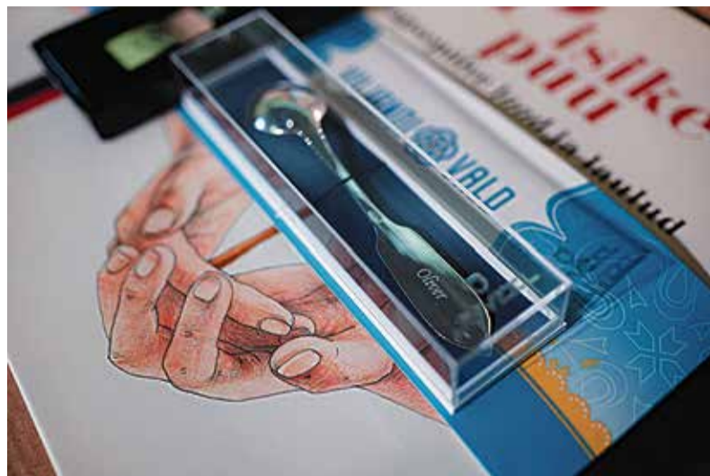
Viljandi vallal on kena komme kinkida vastsündinutele hõbelusikas.

Nimevalikut rikastasid ka mitmed eristuvad ja haruldased nimed, nagu Itti Säde, Engel