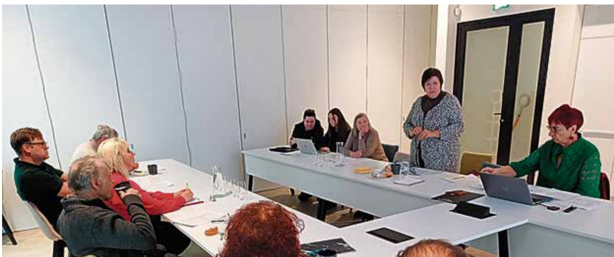
Eakate komisjoni koosolek vallamajas.