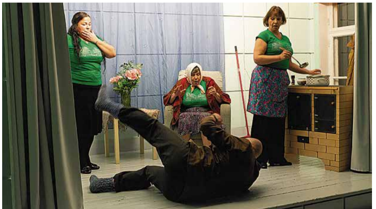
Pärsti Mõisa Teater on tegutsenud aastast 2010.