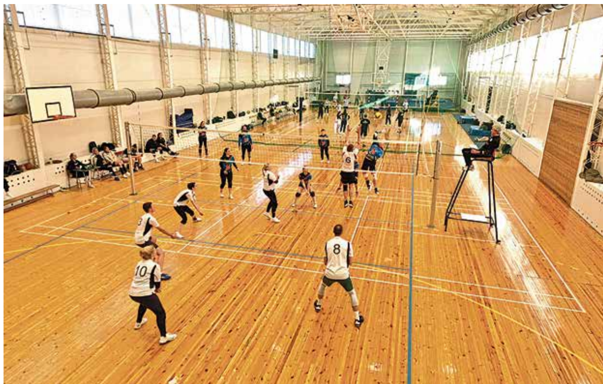
Päri segavolle turniiri V mängudepäev.