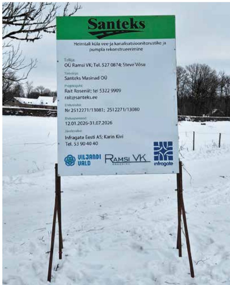
Infotahvel Heimtalis teavitab ehitustöödega seonduvast.

Projekti kogumaksumus koos käibemaksuga on 903 986,55 eurot, mida rahastavad OÜ Ramsi