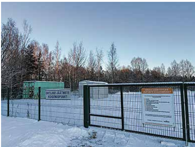
Kolga-Jaani alevikku rajatakse uus jäätmejaam, mis hakkab teenindama nii kohalikke kui ka kogu ümbruskonda.