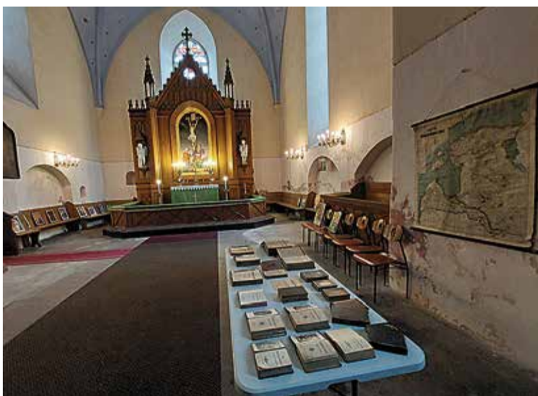
Tänavu on toimunud kirikus mitmeid toredaid sündmusi. Fotol Eesti raamatu 500. aastapäevale pühendatud näitus Paistu kirikus.

On üldteada, et kirik on talviti külm. Praegu pakuvad kuni 20