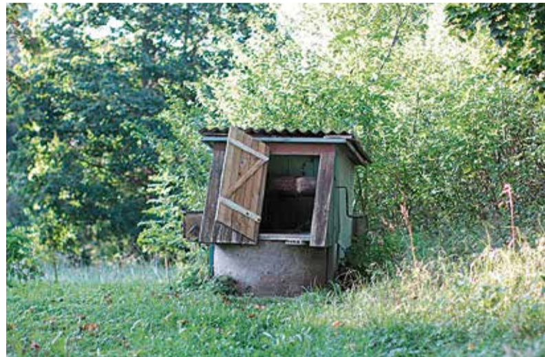
Toetuse abil saab rajada või parendada veevarustuse- ja kanalisatsioonisüsteeme.

Maksimaalne toetuse suurus ühe majapidamise kohta on kuni 6500 eurot ning omafinantseering peab olema vähemalt 33% projekti kogukulust. Programmist eraldatud toetusse loetakse ka veel eelneval kalendriaastal programmist saadud toetuse summat ning iga valdkonna jaoks võib programmist toetust saada üks kord kuue kalendriaasta jooksul.