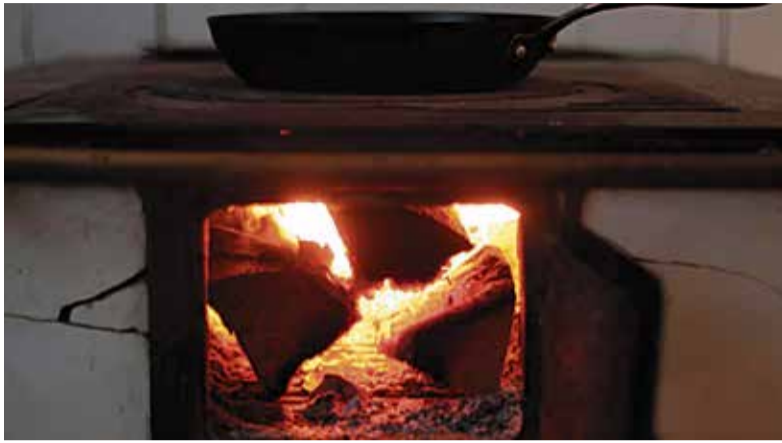
"Kodud tuleohutuks" programmi eesmärk on toetada kohalikke omavalitsusi tuleohutuse tagamisel ja aidata toimetulekuraskustes inimesi.

Toetatavad tegevused on: • küttesüsteemi, sealhulgas gaasikütteseadme parandamine, lammutamine, ehitamine või paigaldamine; • korstnapühkimise teenus; • ehitise audit; • elektrisüsteemi parandamine või uuendamine; • elektriseadme välja vahetamine koos elektrisüsteemi parandamisega või uuendamisega, • elektripaigaldise audit;