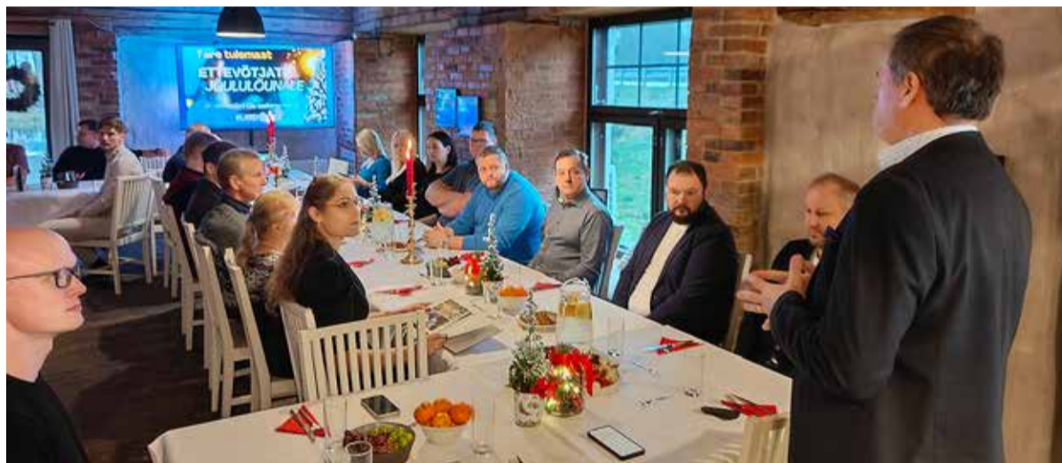
Traditsiooniline ettevõtjate jõululõuna peeti seekord Oiu sadama hubases restos.