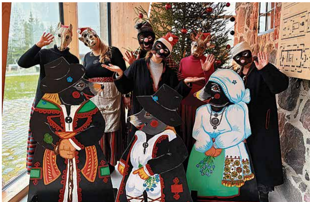
“Müüts Mati Jõulumaa” meeskond Mulgi aabitsa tegelaskujudena.

Täna kõikide Mulgimaa valdade vallavalitsusi ja volikogusid, et nad saavad aru Mulgi Elamuskeskuse rollist Mulgi kultuuri tutvustamisel ning on valmis selle tegevust toetama.