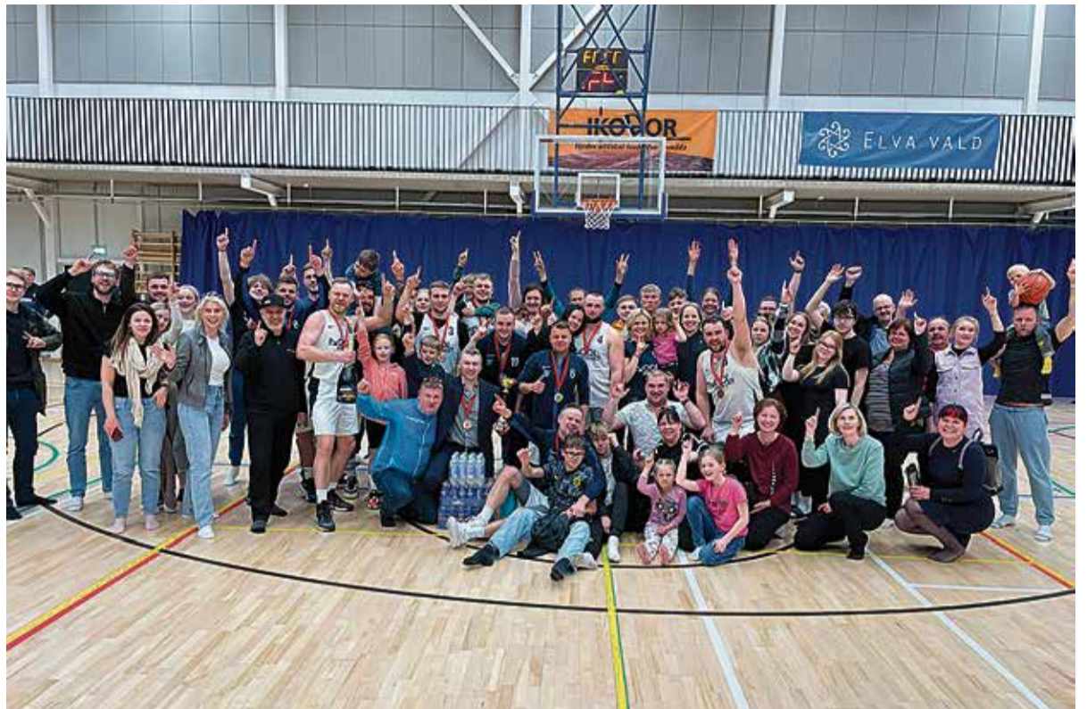
Aasta emotsionaalsemaid hetki oli korvpallurite rahvaliiga turniirivõit. See oli ühine võit – korvpallurid ja fännid koos!