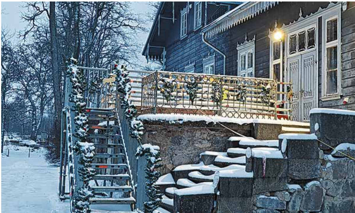
"Jõulusära 2025" võitja on Pärsti mõisa lasteaia trepi jõulukaunistus 372 meeldimisega!