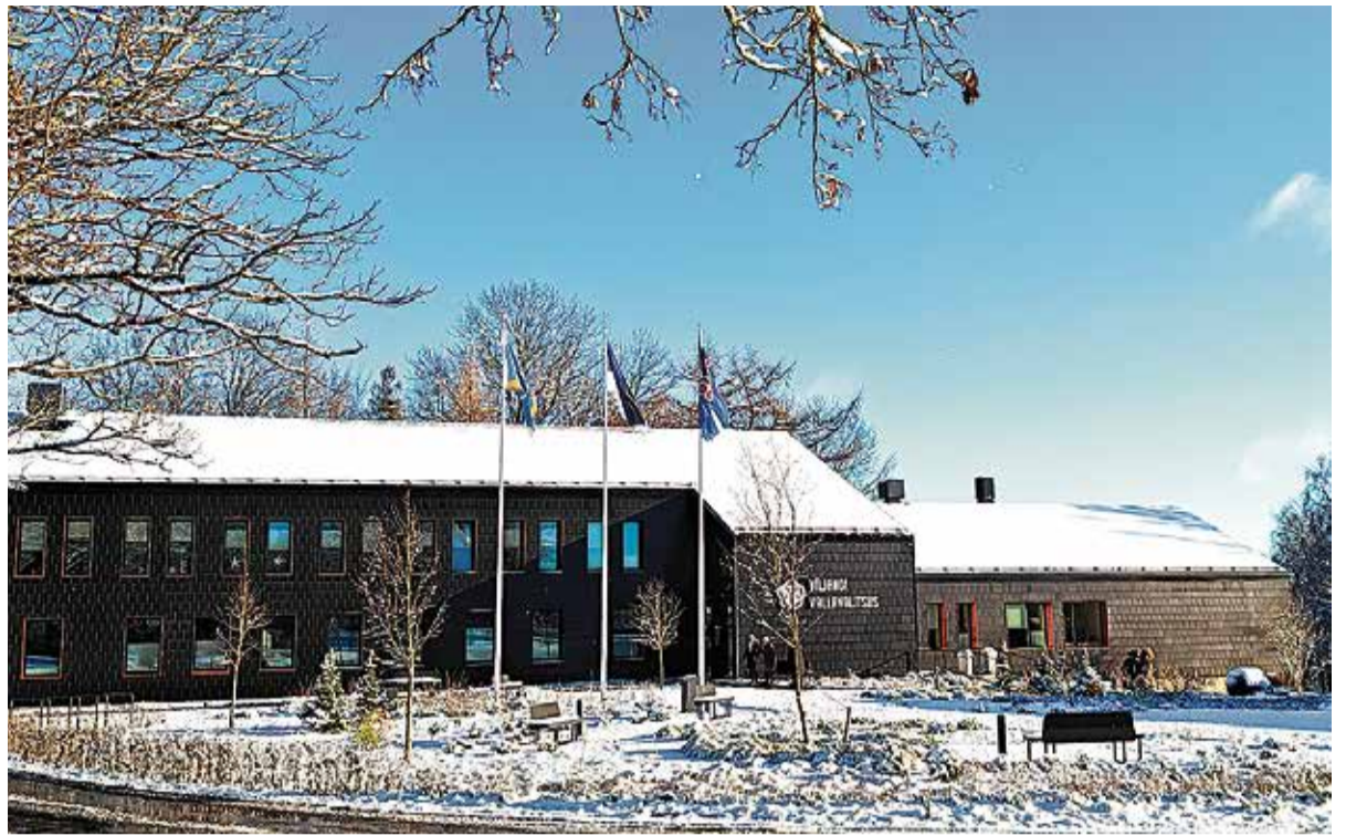
Detsembris toimus lausa kolm vallavolikogu istungit.

Järgmine vallavolikogu istung toimub 29. jaanuaril.