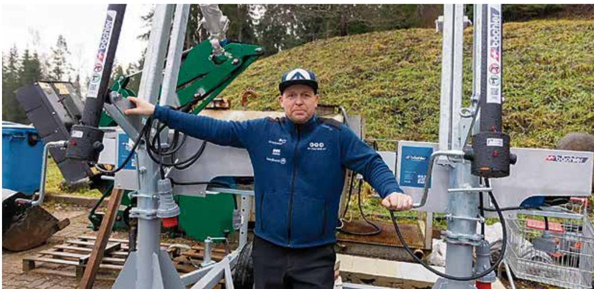
Holstre-Polli spordikeskuses ei saa töö kunagi otsa.