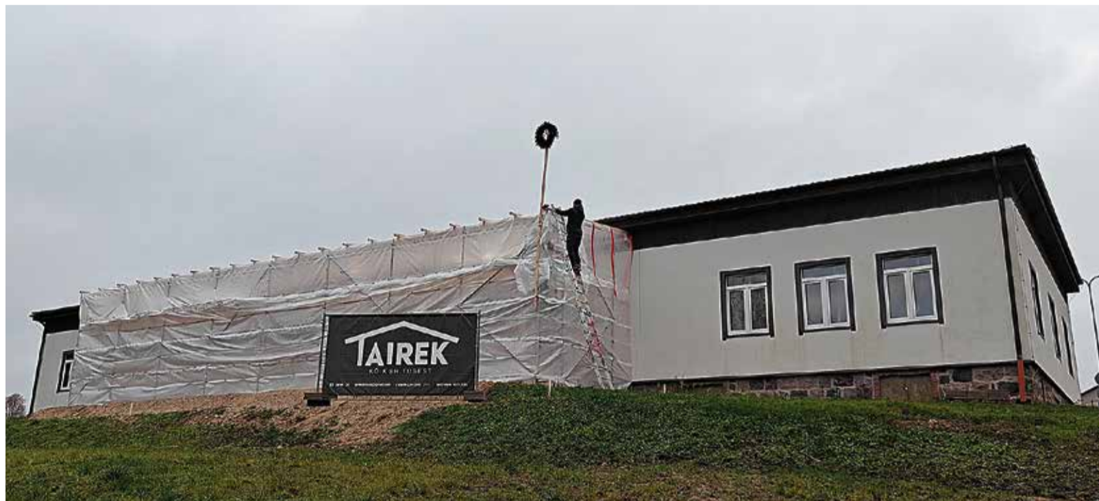
Viiratsi kogukonnamaja jõudis sarikapeoni. Traditsiooni kohaselt ootas katuseharjal pärg oma alla toojat.