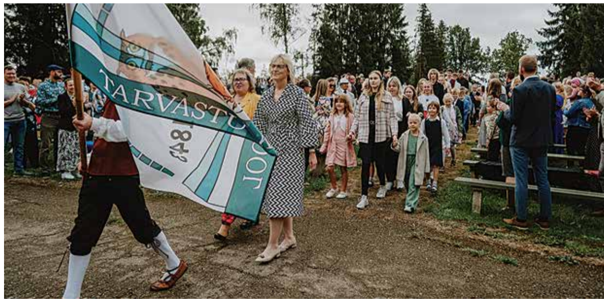
Tarvastu Gümnaasiumis on saanud kauniks traditsiooniks, et kõige nooremad koolijütsid laskuvad mäenõlvalt alla abiturientide käekõrval.

Tarvastu Gümnaasiumis alustas sel sügisel õpinguid 295 õpilast , neist 26 esimeses klassis ja 29 noort kümnendas klassis . Ühtlasi tõi direktor esile uuel õppeaastal ees ootavad muutused – koolikohustus asendub õppimiskohustusega. Mis tähendab, et haridustee ei lõpe põhikooli lõpetamisega, pärast seda tuleb edasi minna kas gümnaasiumisse või kutseõppesse ja kohustuslik on see vähemalt kuni 18nda eluaastani.