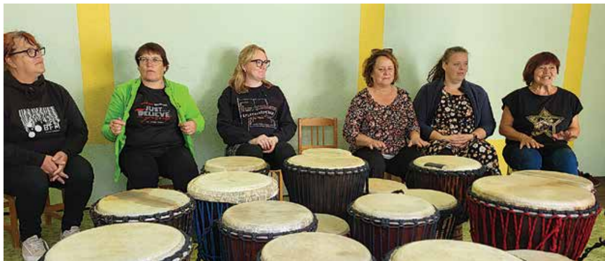
Djembe töötoas kogesid õpetajad lõbusat ja kaasahaaravat grupitegevust.