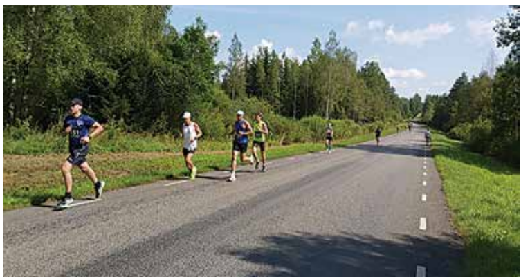
Paistu poole teel