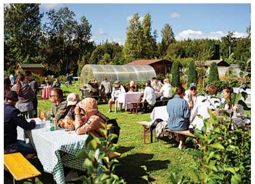
Esimesel kodukohvikute päeval avasid oma ukseid seitse kodukohvikut.