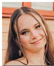
Inganora Makko Viljandi valla noortevolikogu esimees

Laste- ja noorteala möödus pigem vaikse meeleolus. Üheks võimalikuks põhjuseks oli kogu ürituse ala suur hajuvus, mistõttu jagunesid külastajad laiali ja liikumine eri alade vahel jäi tagasihoidlikuks.