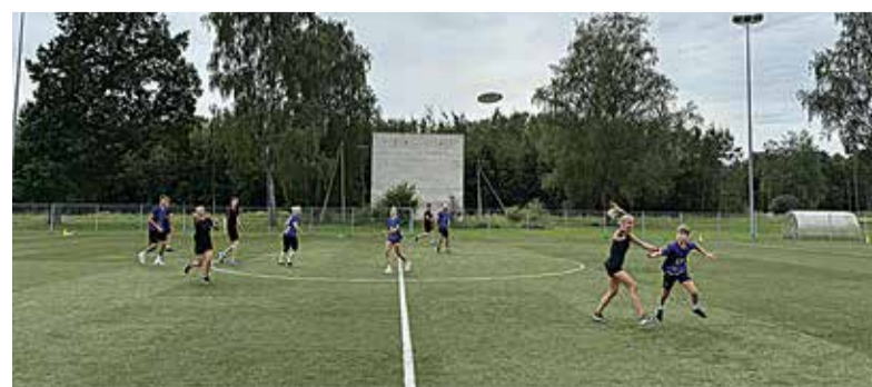
Mänguhoos ollakse ultimate frisbee turniiril Mustlas.