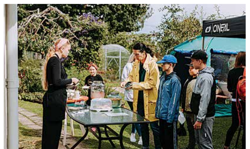
Osalejate hulgas oli nii uusi tulijaid, kui juba eelmisest aastast tuttavaid kohvikupidajaid.