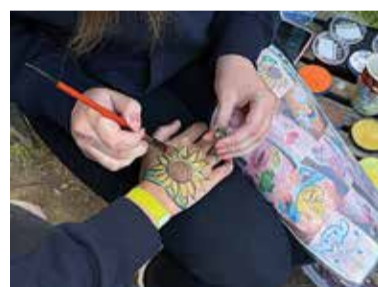
Maalinguid tehti nii näole kui ka käele.

Samuti sai mängida pinksi ning MTÜ Mõõgavennad töid kaasa oma mängud ja tegevused, mis pakkusid põnevust ja kaasahaaravat ajaviidet. Kuigi sel aastal oli üldine melu pisut rahulikum kui varasematel kor-