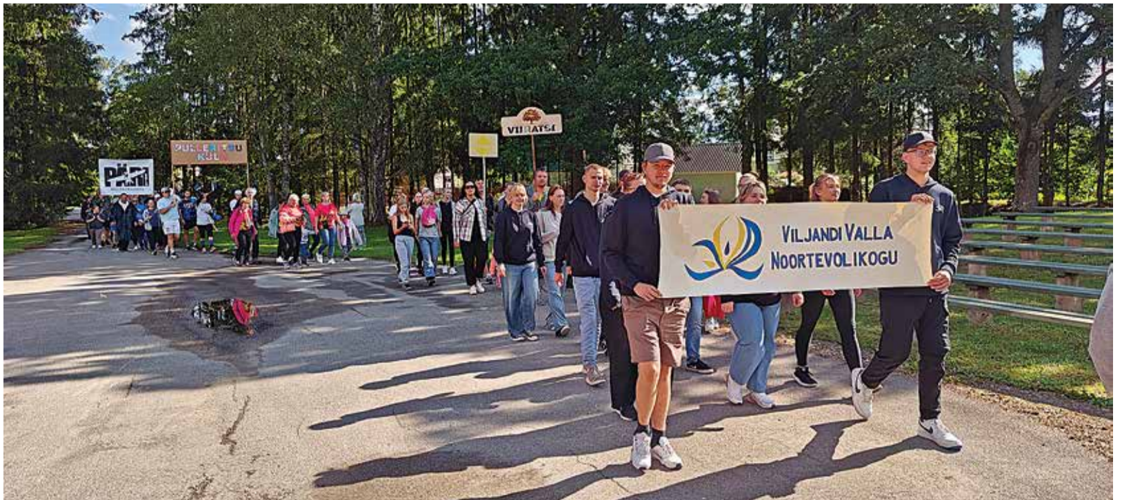
Seekordnegi külade päev algas piduliku rongkäiguga, siis tulid tervitused ja päev võis alata.

Oleme juba alustanud aasta 2026 külade päevade planeerimisega. Selleks korjame tagasisidet, mida võiks järgmisel aastal teha teisiti. Praeguseks on küsitluse põhjal alust arvata, et tänavust sündmust võib lugeda kordaläinuks. Tähelepanekud ja ettepanekud edaspidiseks planeerimiseks on, et spordi võistlused ja valla külade päev pidada erinevatel aegadel, arvestades, et tegevused oleksid koondunud väiksemale alale. Samuti soovime järgmistel aastatel kaasata kogukondi rohkem ning anda neile vabadust ise ot-