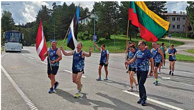
Balti keti teatejooksjad jõudsid Viljandi valda.

Kui jooksjad Viljandi poole teele saadeti, moodustasid inimesed rivis kätest kinni hoides väikese inimketi ja õõtsusid Balti keti laulu saatel. See hetk pani paljudel südame kiiremini põksuma – täpselt nagu 1989. aasta augustiõhtul.