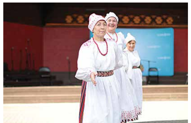
Fotol naisrühm Ramsi Roosid.