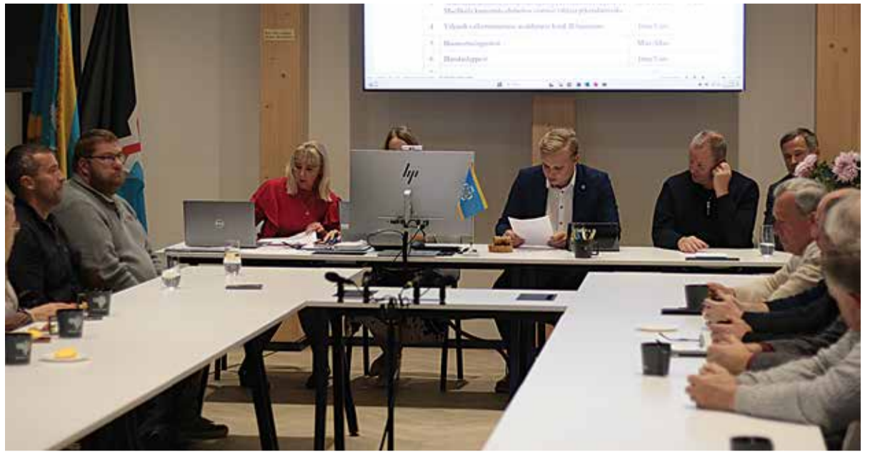
Vallavalitsuse 28. augusti istungil oli palju olulist. Lähemalt saate lugeda kõrvalolevast loost.