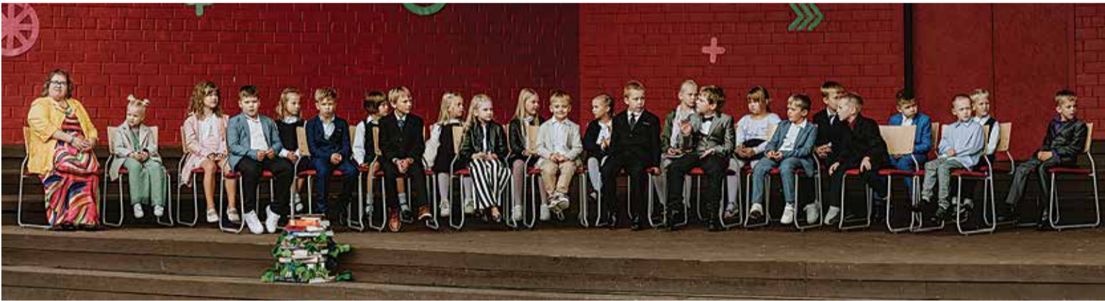
Tarvastu Gümnaasiumis alustas sel sügisel õpinguid 295 õpilast, neist 26 esimeses klassis ja 29 noort kümnendas klassis.