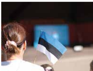
Külade päevaga tähistati ka Eesti taasiseseisvumise päeva. Seepärast lehviti ja lehvitati hulgaliselt igasuguses suuruses rahvuslippe