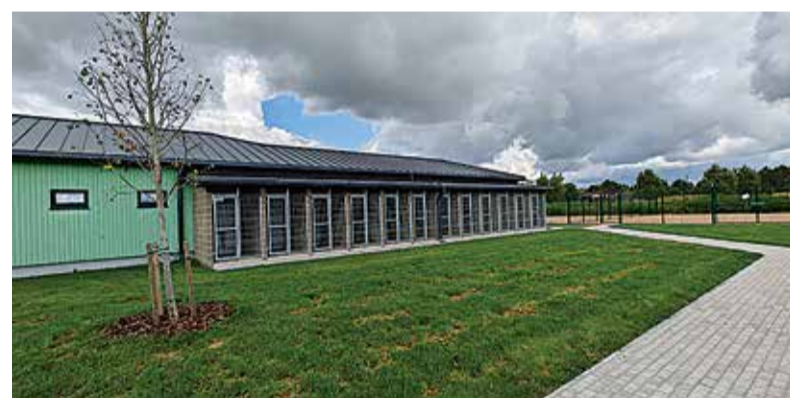
Liginullenergiahoone võimaldab hoolitseda projekti kohaselt kuni 16 koera ja 106 kassi eest.

Uus ühekorruseline ja energiatõhus hoone sisaldab administratsiooni- ja olmeruumi töötajatele, loomade vastuvõtu- ja karantiiniplokki, koerte ja kasside bokse koos veterinaarja sanitaarploki ruumidega ning