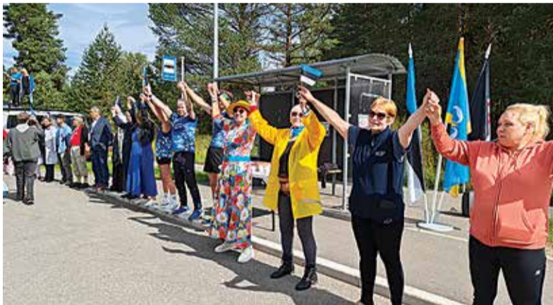
Kui jooksjad Viljandi poole teele saadeti, moodustasid inimesed kätest kinni hoides sümbolise inimketi.

Viljandis peatuti Vabaduse platsil, kus mälestussamba jalamile asetati kolme Balti riigi värvides paeltega pärg.