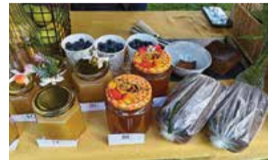
Läbi päeva tutvustasid end kogukonnad, kes avasid oma telgid.

Viljandi valla külade päev kujunes elavaks ja rõõmsaks koguperepeoks, kus igaüks leidis