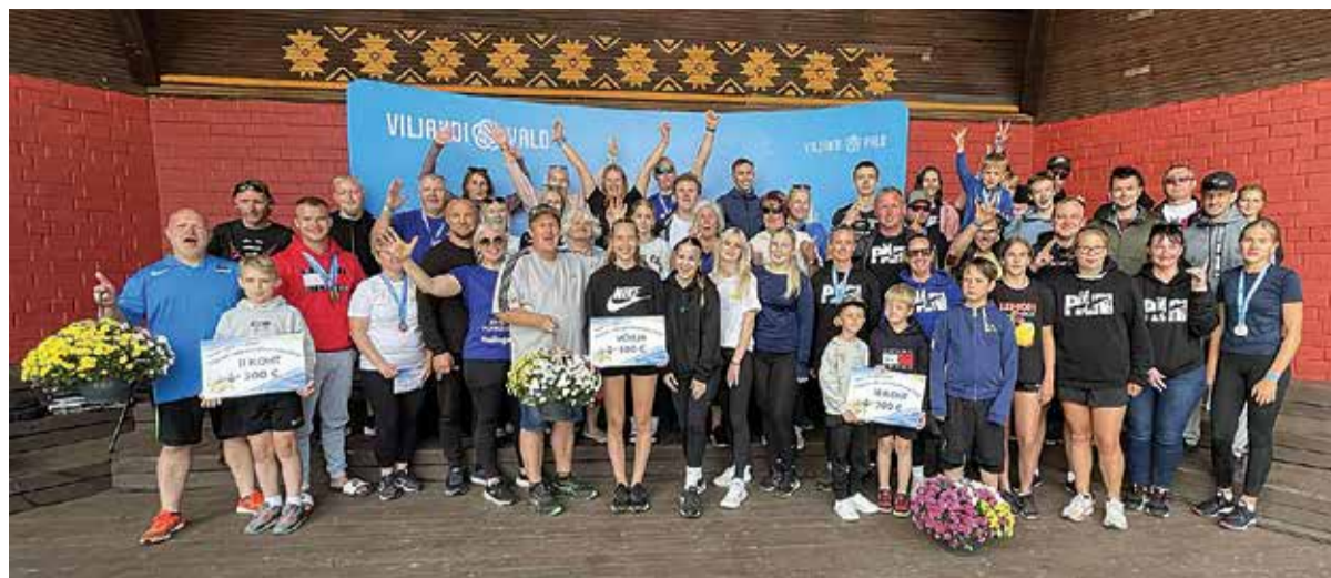
Sportlikumad külad 2025: vasakult Kärstna/Pahuvvere, keskesl Soe/Kivilõppe ja paremal Päre.