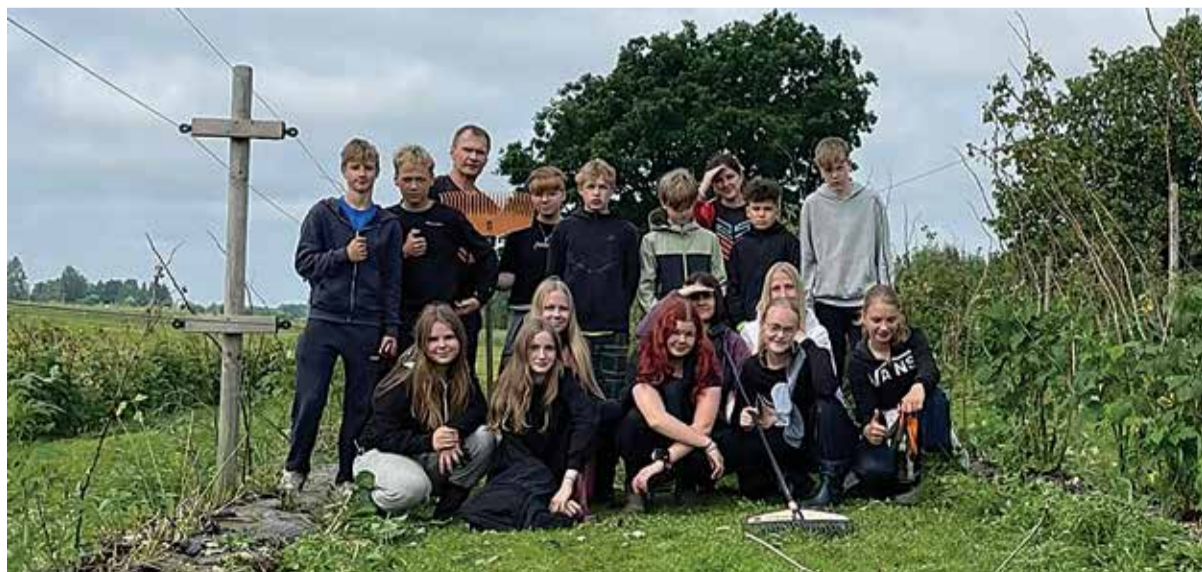
Paistu malevarühm Mesimari vaarikapõllul.

Malevasuvi ei tähenda ainult tööd – see on ka areng, uued sõbrad ja väärtuslikud kogemused. Meil on põhjust uhkust tunda: sel aastal täitsid kolme