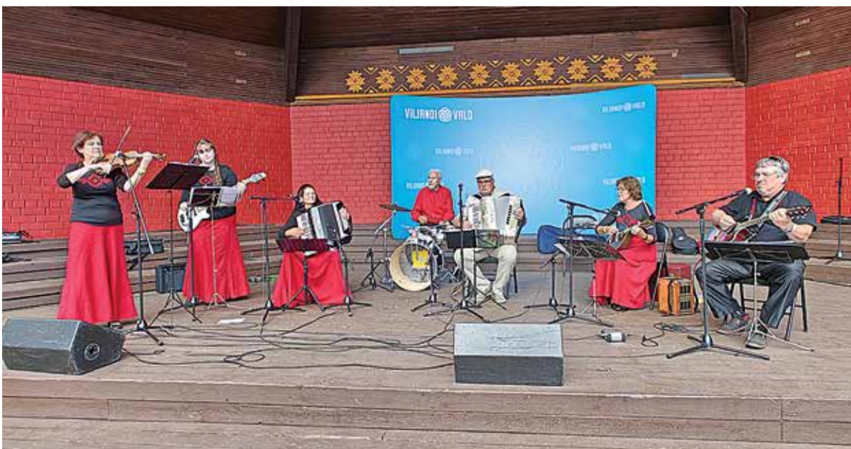
Musitseerib Saarepeedi kapell.

Tulevikus võiks kaaluda kultuuri- ja spordiprogrammi ajalist hajutamist, et külalistajad saaksid kõiki pakutud tegevusi täiel rinnal nautida.