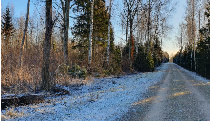
Foto 4. Vaade planeeringualal loodest