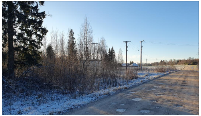
Foto 3. Vaade planeeringuala põhjaosale Sabaku-Vardi teelt