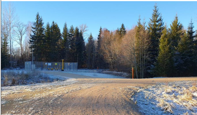
Foto 6. Vaade planeeringualale idast