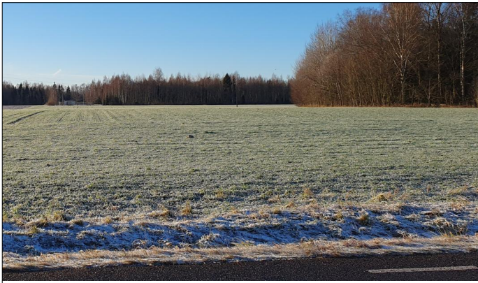
Foto 2. Vaade planeeringualale kirdest Raudna-Loodi teelt