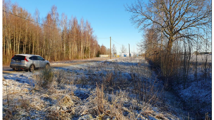
Foto 5. Vaade planeeringualale edelast