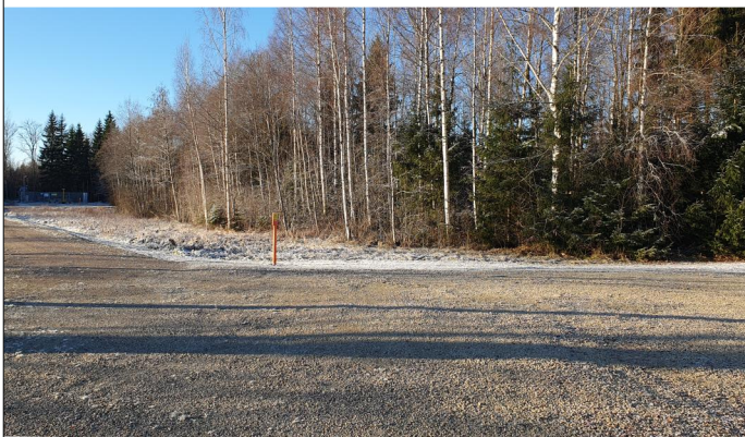
Foto 8. Vaade planeeringualale idast