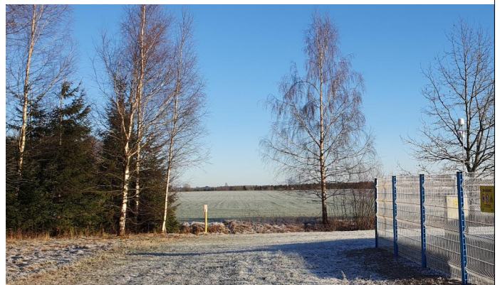
Foto 9. Vaade planeeringuala idanurgast Raudan-Loodi suunal