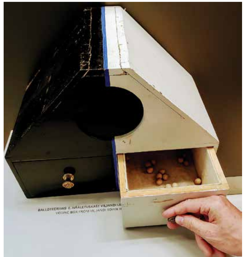
Tegemist on juba tsaariajal Viljandi linnas kasutusel olnud valimiskastidega, kus hääletati kuulikestega. Foto on tehtud Viljandi muuseumis.

1) Teisel päeval (reede) enne valimispäeva ja valimispäeval