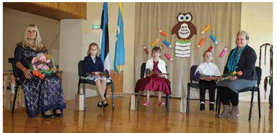
Laval istuvad oma päris esimesel koolipäeval Kolga-Jaani Kooli õpilased.