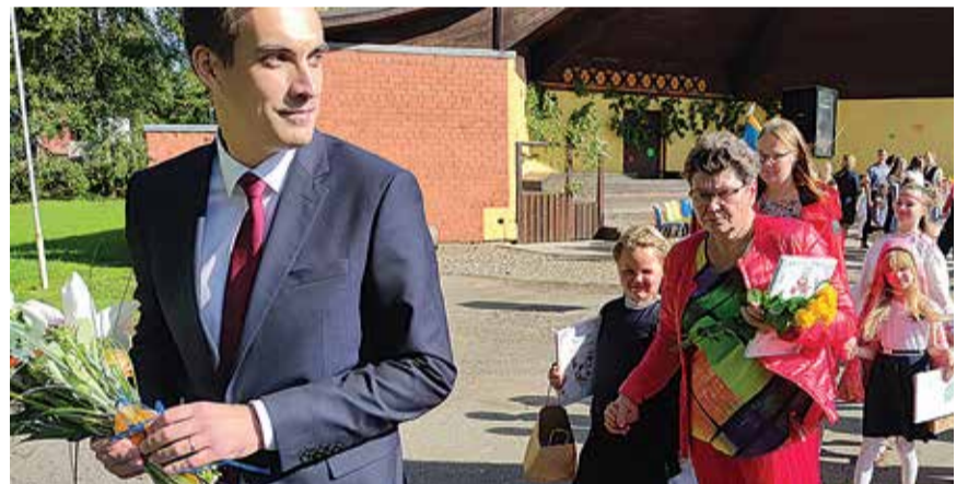
Hetki 1. septembrist Tarvastu Gümnaasiumis.