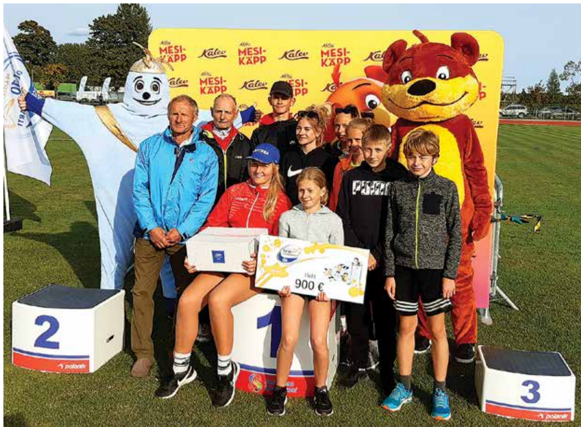
Nemad võitsid 10 Olümpiastarti juubeliaasta võistkondliku mitmevõistluse Kuressaares.