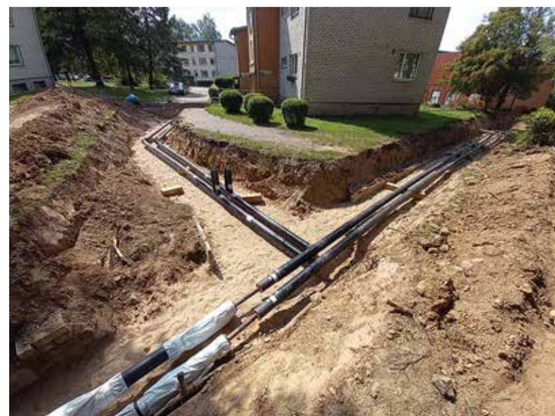
Jäädvustus Viiratsi soojustorustiku rekonstrueerimisest 2021. aasta juulis