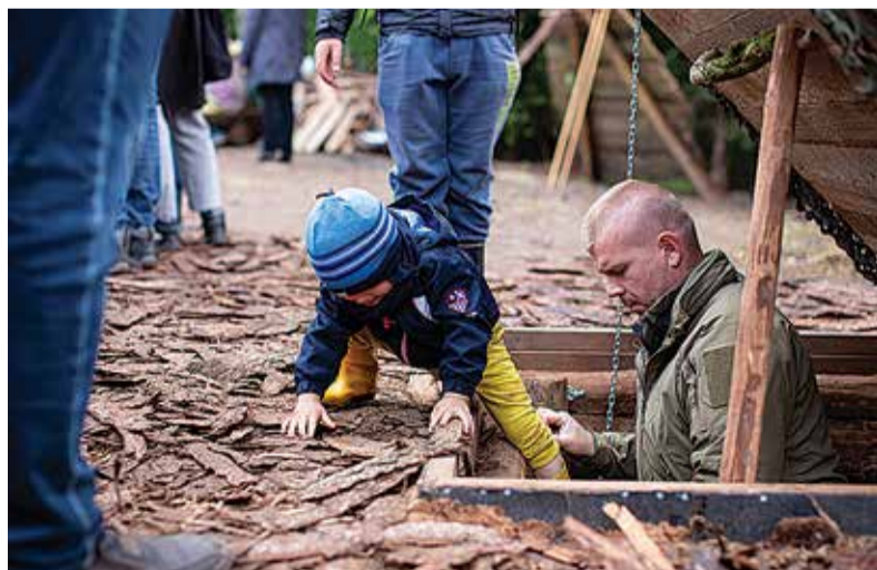
Punker säilitab ajaloolist mälu praeguste ja tulevaste põlvkondade jaoks.

päästis kuiv suvi, kus saadi kaotatud aega tagasi võita,” ütles Perve. “See aga oli töömeestele kuumuse tõttu väga raske ja keeruline, tööpäevi tuli alustada varahommikul kella viiest. Vaprad mehed ei vandanud alla ja töötasid visalt vaatamata praadivale päikesele ning sääskede ja parmude rünnakule.”