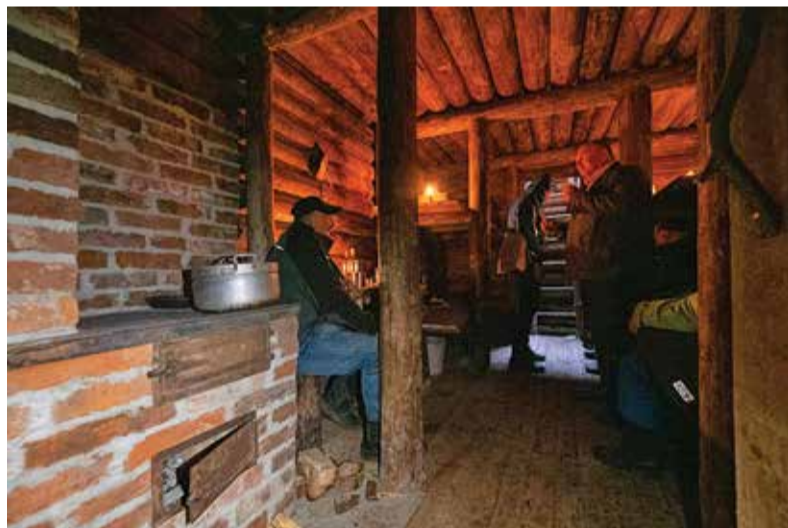
Punkris on kaks sisse ja väljapääsu, kuus nari ja pliit.