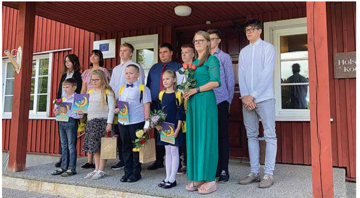
Nõnda nägi esimene koolipäev välja Holstre Koolis.