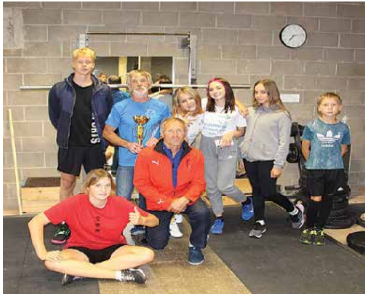
Valla tõstjate esindus Sakala mängudel.