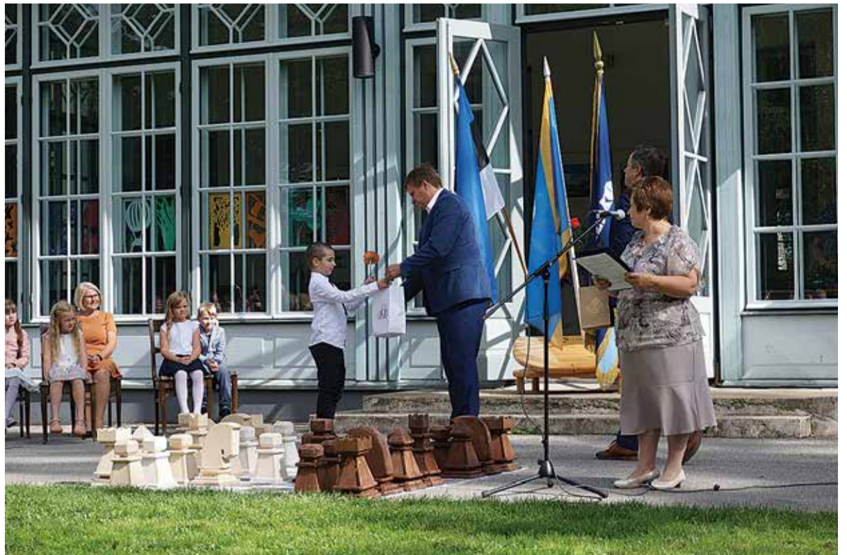
Malemängule üles ehitatud esimese koolipäeva aktus Heimtali Põhikoolis.

Põnev, innustav ja turvalist kooliaastat kõigile!