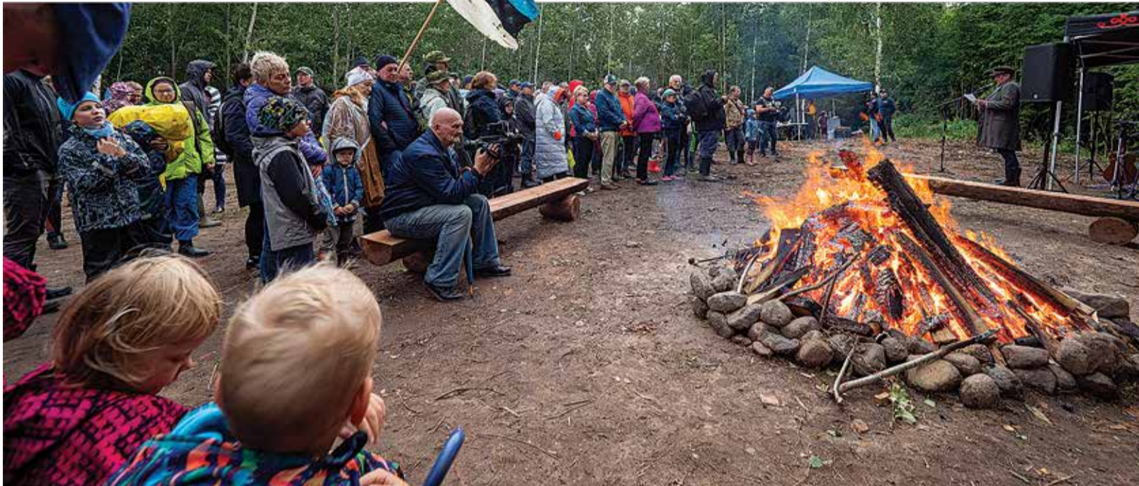
Taastatud punkri avamisele kogunes palju rahvast, järelikult on huvi meie mineviku vastu suur.