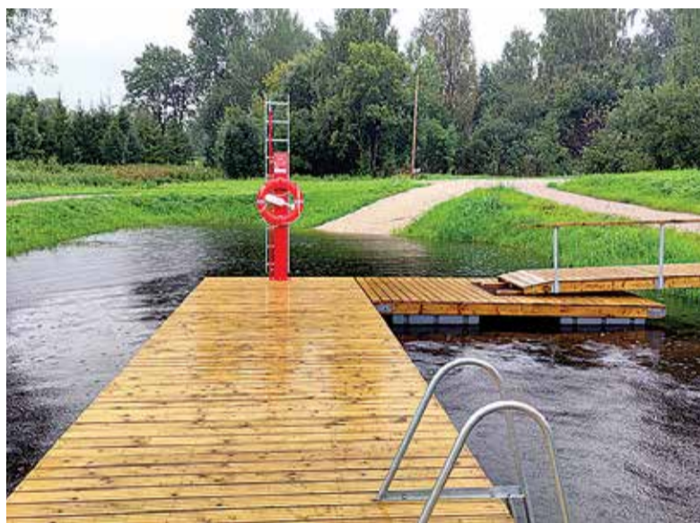
Kuigi Surva silla ujumiskoht valmib lõplikult aasta lõpuks, sai juba tänavusel kuumal suvel kenasti siin veemõnusi maitsta.

Surva ujumiskoht on olnud ammustest aegadest kohalike poolt kasutatav ja nõ isetekeline, ning seal käiakse ujumas juba aastaid. Vajadus turvalise-