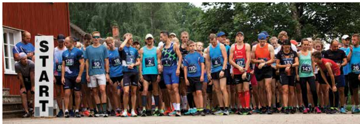
Mõni hetk veel ja antakse start Holstre - Paistu jooksule.