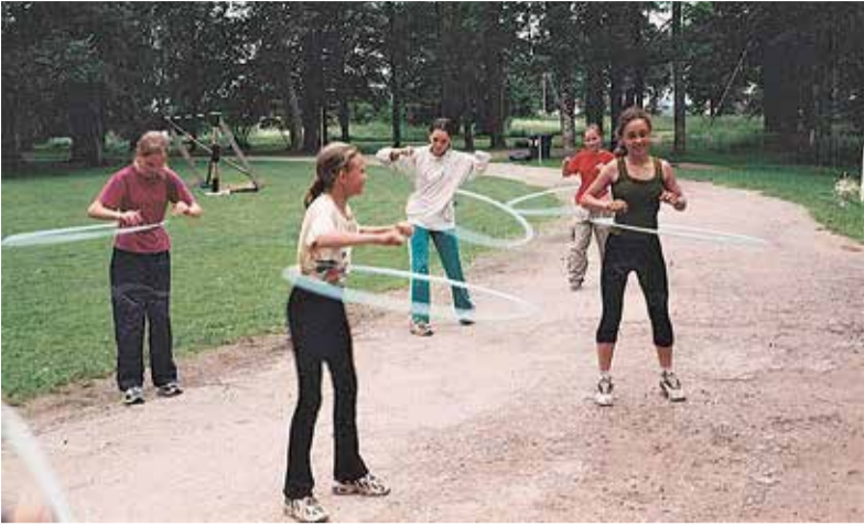
Kehalise kasvatus tunde Heimtali mõisapargis 1990. aastatel.