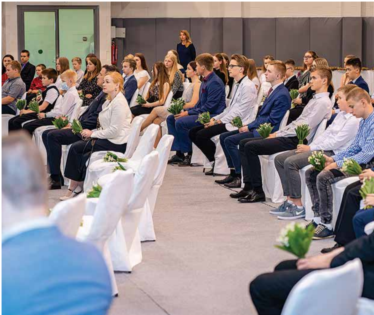
9. juunil olid Heimtali ringhoonesse kutsutud noored, keda vallavanem tänas tubli õppimise ja koolivälise töö eest.

Head lõpetajad, te olete teel ja teelolemine on teie eelis!