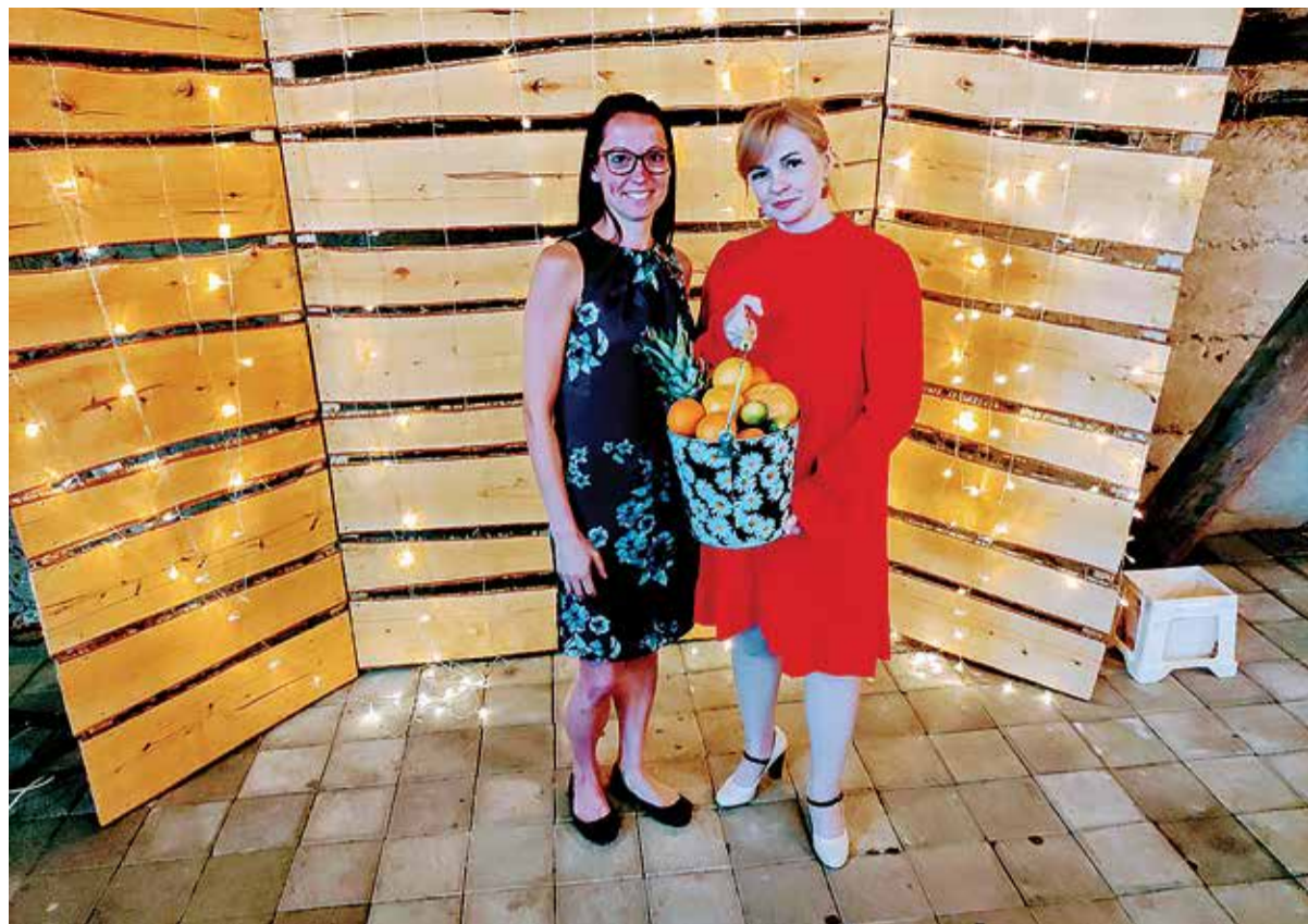
Sotsiaaltöö päev kujunes meeleolukaks nagu alati: autasustamised, kohtumised, kingitused – mida muud ongi üheks toredaks ettevõtmiseks vaja.