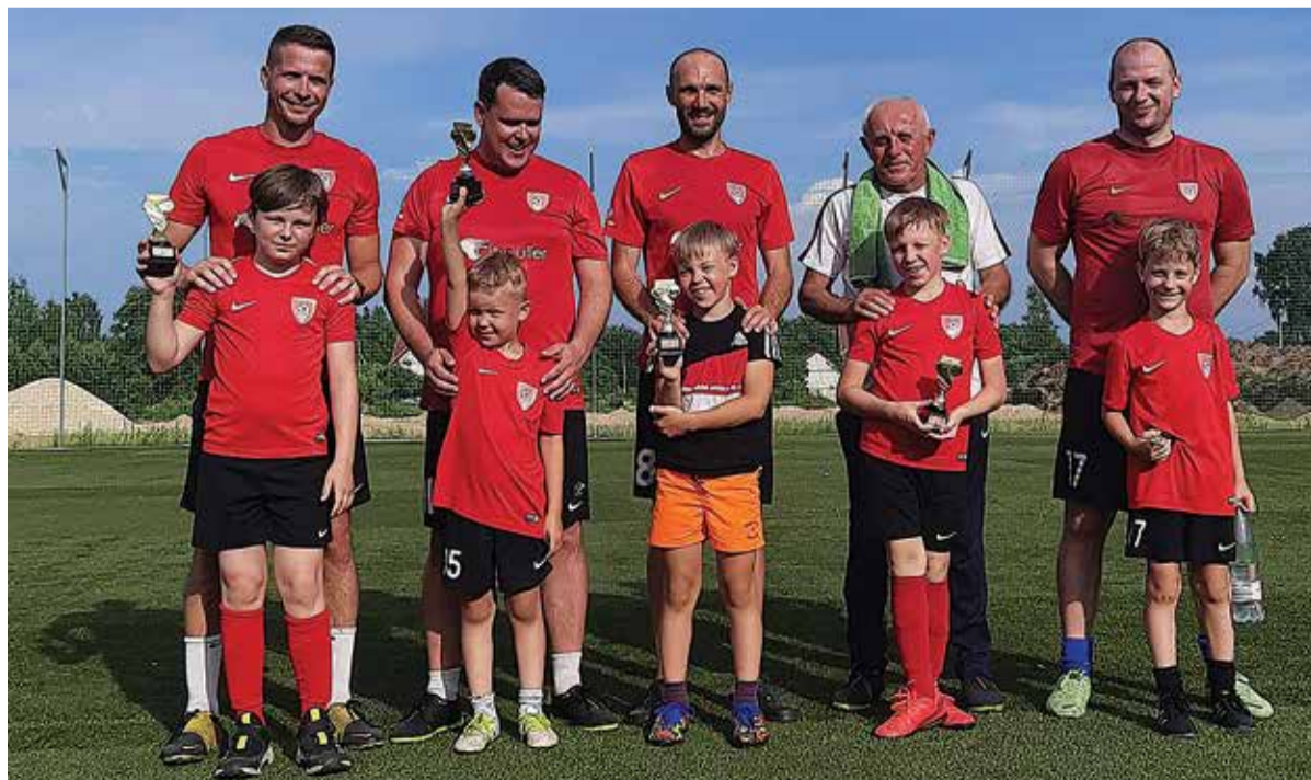
Jalgpallis võidu võtnud kogenud Tarvastu FC mängijad kinkisid oma võidukarikad kõige väiksematele tuleviku tähtedest jalgpalluritele.