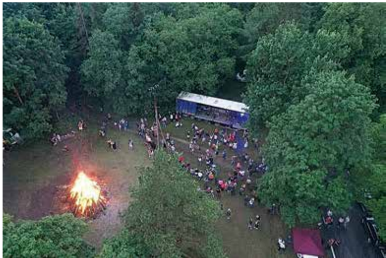
Hoolimata sellest, et kurikaelad süütasid ettevalmistatud lõkke päev varem, õnnestus korraldajatel uus lõke teha ning rahvas tuli peole – hinnanguliselt 300 autot ja 500 peokülast.

Järgmised Viljandi valla noortepäevad toimuvad 2022. aasta juuni viimastel päevadel ning need saavad olema veel mitmekesisemad ja vägevamad.