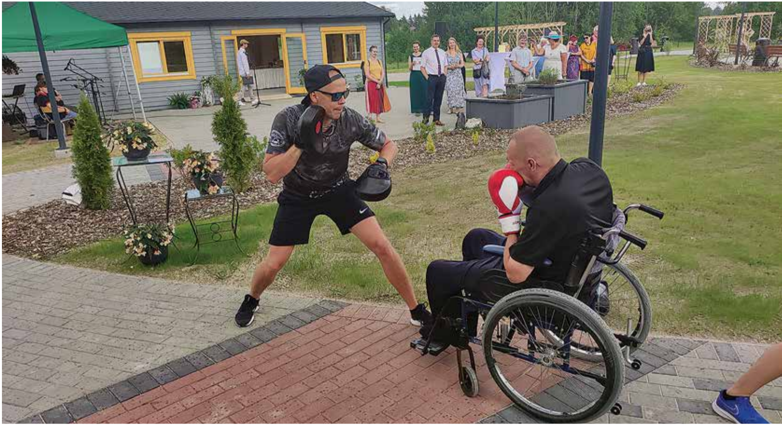
Viljandi Taipoksiklubi eestvõttel on pansionaadi elanikud juba üle poole aasta end tai poksiga kehaliselt vormi viinud. Nüüd, aia avamisel, oli õige aeg oma oskusi külalistele näidata.