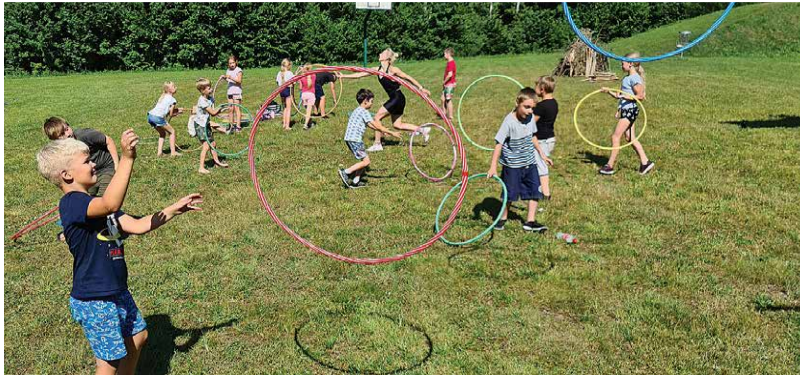
Noortepäevadest saavad osa võtta kõik Viljandi valla noored vanuses seitse kuni üheksateist eluaastat.