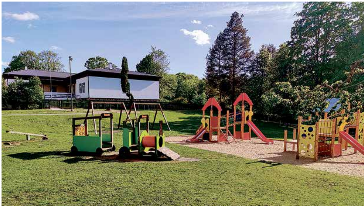
Tühja lasteaia mänguväljakut on küll kena vaadata, aga kenam oleks veel kui lapsed sellele platsile melu ja elu juurde annaksid.

„Saarepeedi, Tarvastu (sealhulgas Kärstna ja Soe maja), Leie, Kolga-Jaani, Holstre, Paisu, Päre (sealhulgas Pärsti ja Puiatu rühm) ning Uusna lasteaia mänguväljakud on olnud