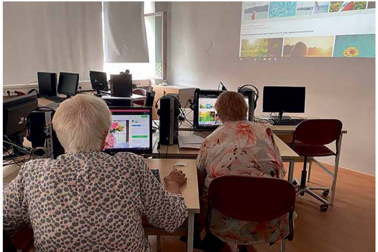
Igal laupäeval, kuu aega järjest omandasid Viljandi valla eakad uusi arvutioskusi. Õpetajad olid rahul, arvatastasti õppijad ka.