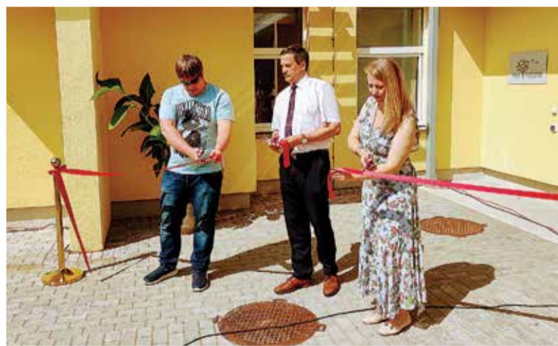
Lint on läbi lõigatud, avamisüritus saab alata.

Pärsti pansionaadi aed on tõeline unistuste aed, mis mõnda aega tagasi oli veel tühermaa. Ent vald eraldas selle maa pansionaadile ja praeguseks on