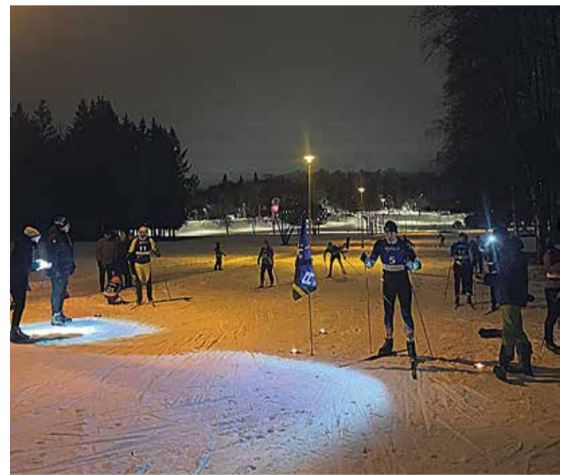
Viljandimaa suusasari esimene etapp peeti Valuoja orus.