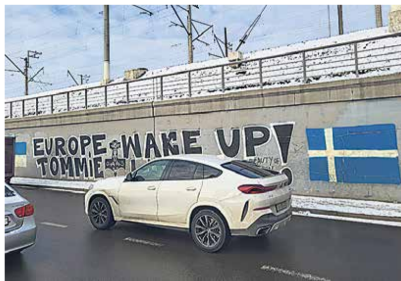
Euroopat äratada püüdev üleskutse ühel Kiievi sillal.

Sinna sõites imestasime, et need teed on nii korralikud ja lund pole. Sellises korras teid pole ma isegi Soomes näinud, Eestist rääkimata. Kiirteede ääres nägime ainult palju hek-