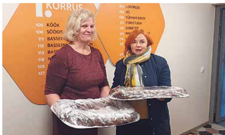
Veel sünnipäevahetki ja pidulisi.

Eks alguse ajad olidki rasked ja keerulised. Kõigepealt tuli kokku sulutada neli omavalitsust: Paistu, Saarepeedi, Pärsti ja Viiratsi vallad. Kohe järgmisel uuel volikogul ja valitsusel tuli saada hakkama veel lisaks kahega: Kolga-Jaani ja Tervastu