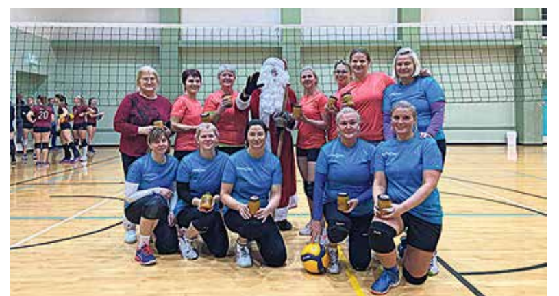
Viljandi valla võrkpallinaiskonnad koos jõuluvanaga.

mängu eest! Viljandi vald tegi meestele ka väikese jõuluüllatuse. Soovime meeskonna liik-