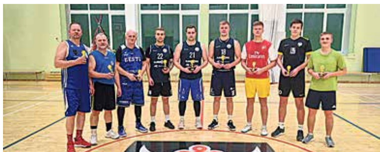
Jõuluturniiri parimad 3 x 3 korvpallis.