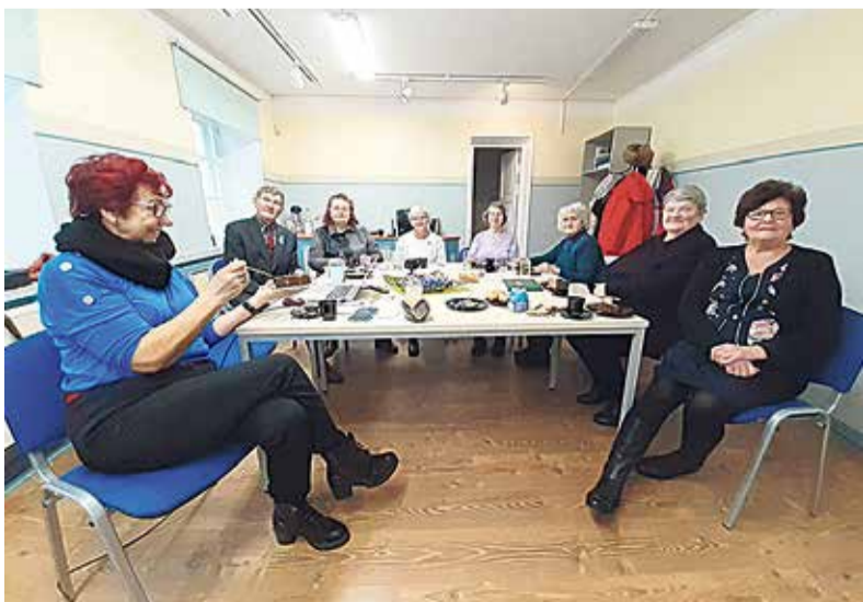
Väärikate kogu kutsub liikumispäevadest osa võtma ja oma liikumisi kirja panema liikumiskaardil.

Hoia enda tervist aktiivse liikumisega toonuses ja osale liikumispäevakutel! Viljandi valla Väärikate Kogu juhatus nimel Ene Saar