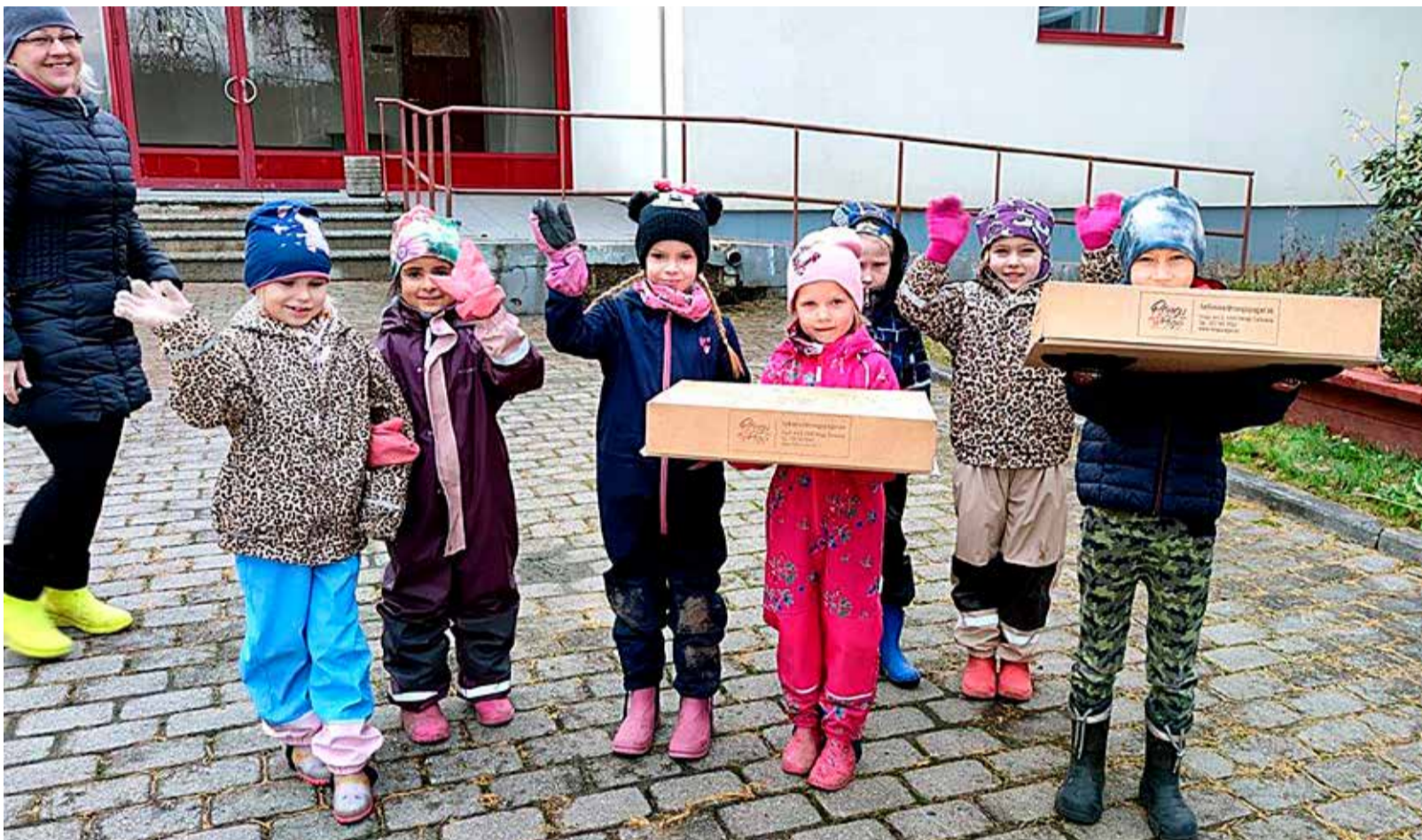
Viljandi valla tulevik tähistamas koduvalla sünnipäeva. Aga just nõnda saab kodukant noortele ka lähedasemaks ja toob tulevikus soovi koduvalla hoida ja arendada.

Valla ja kogukonna koostööpäev tuleb taas!