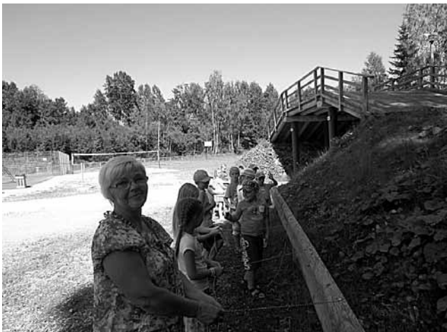
Ka mina proovisin kätt paelte punumisel.