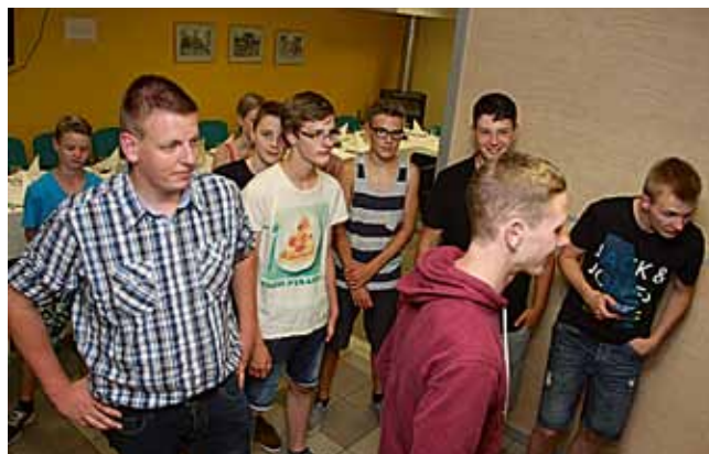
Bippeni noored saavad osa noortelaagri tegemistest.