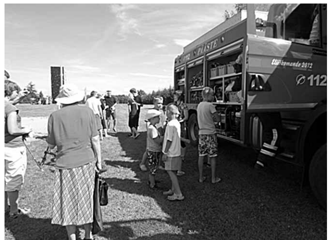
Tutvuda sai päästeauto sisemusega.