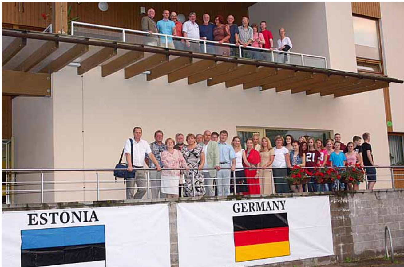
Külaliste vastuvõtt Holstre-Pollis.