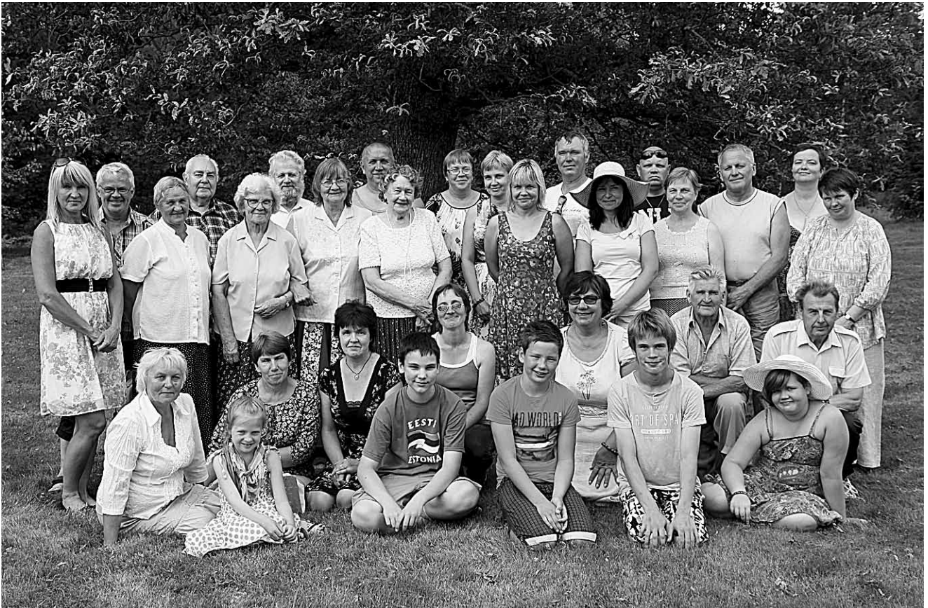
Vardi küla endised ja praegused elanikud koos vallavanemaga ühispildil.