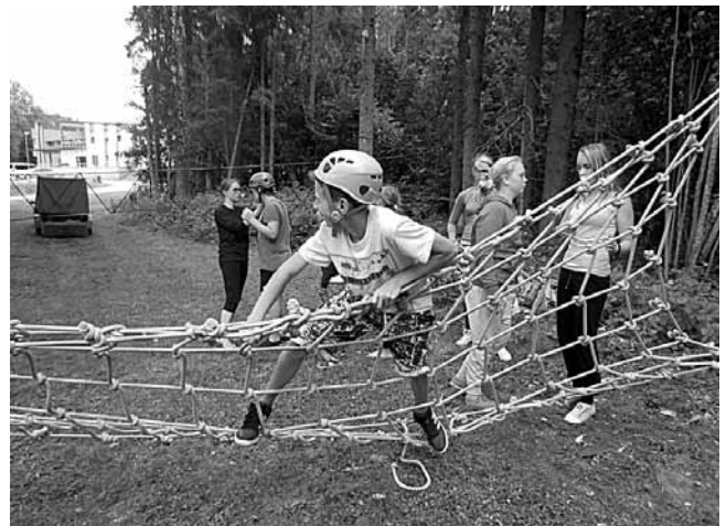
Osavuse proov madalal seiklusrajal.