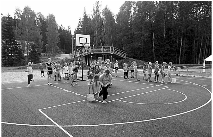
Teatevõistlus on hoos.