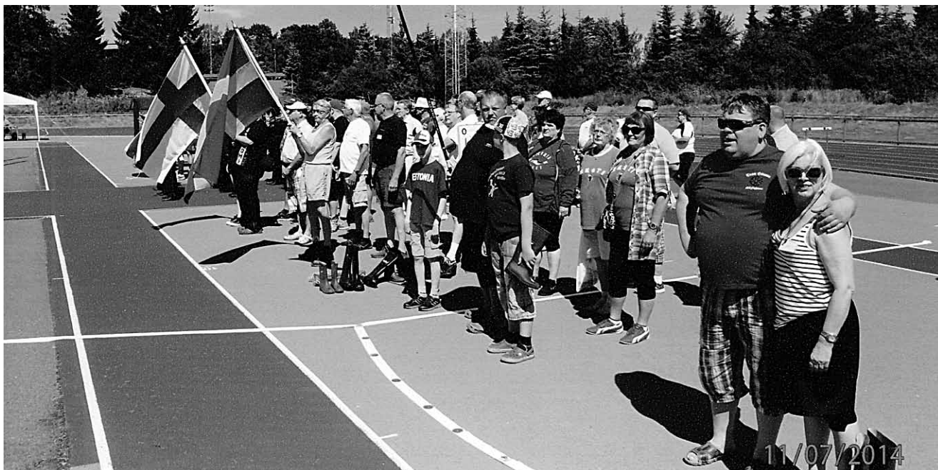
Võistluste avamisel 11.juulil Eskilstunas.