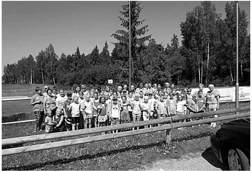
Hetk laagri avamiselt.