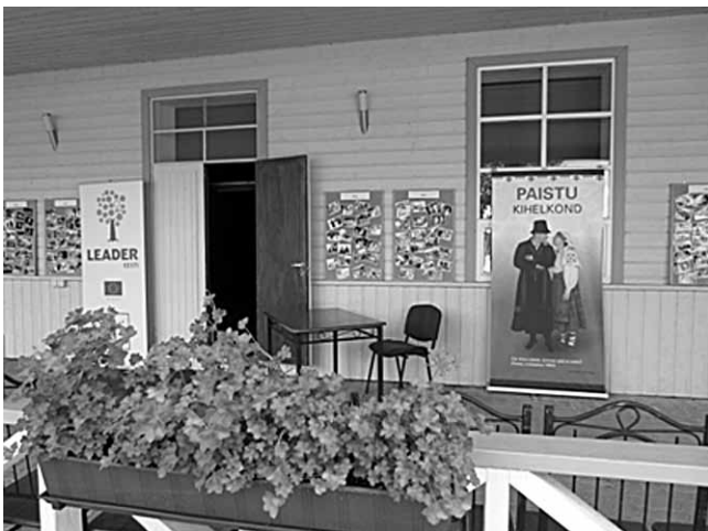
Näitus "Hetki Paistu kultuurielust".