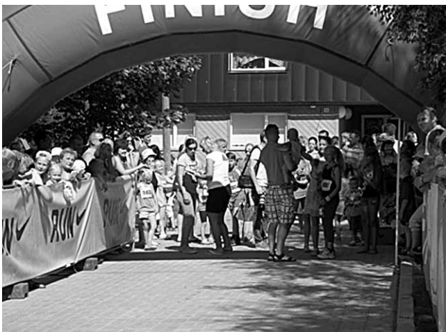
Stardis on väikesed jooksjad.