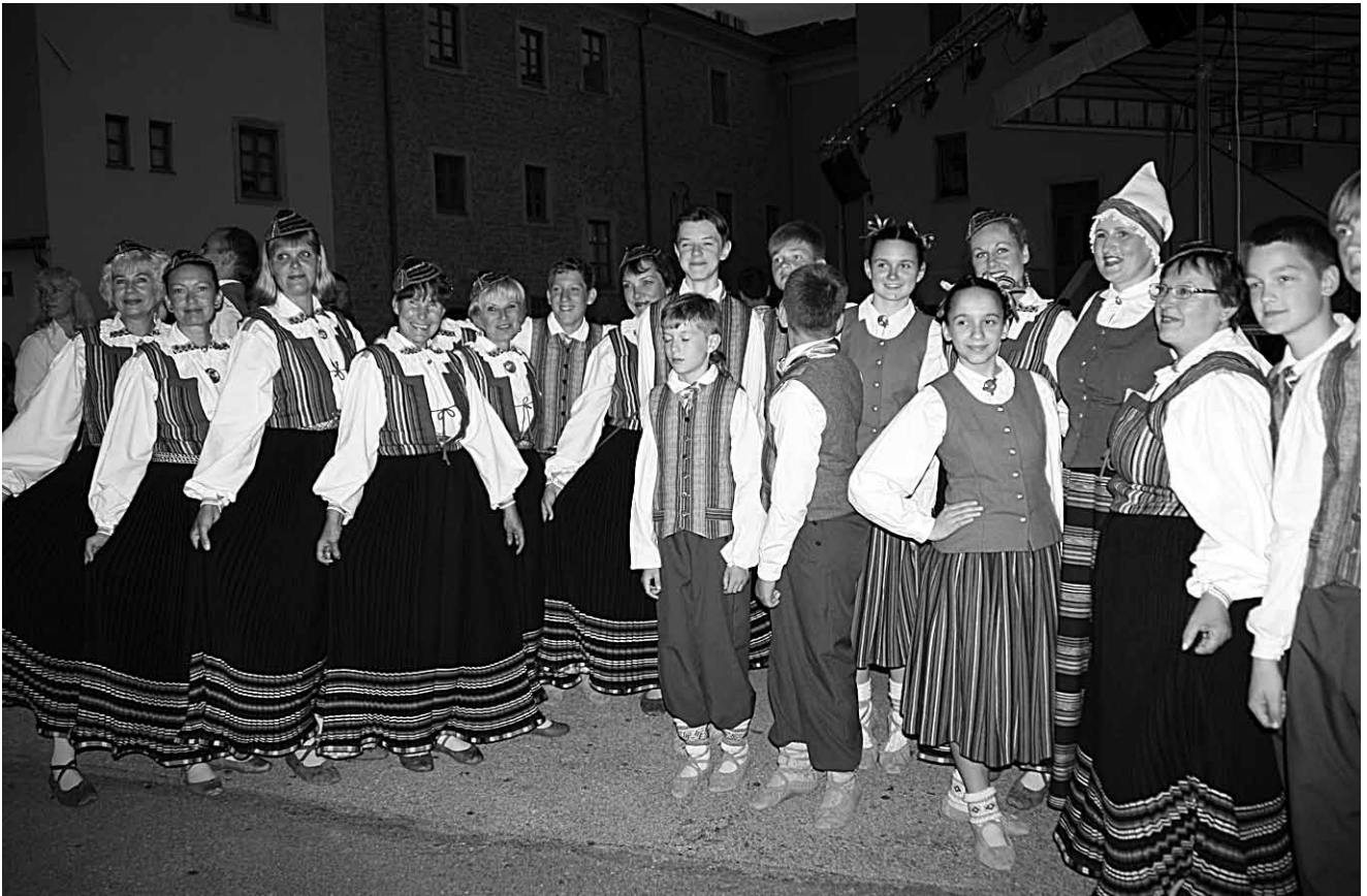
Udusõle tantsijad lätlastega.